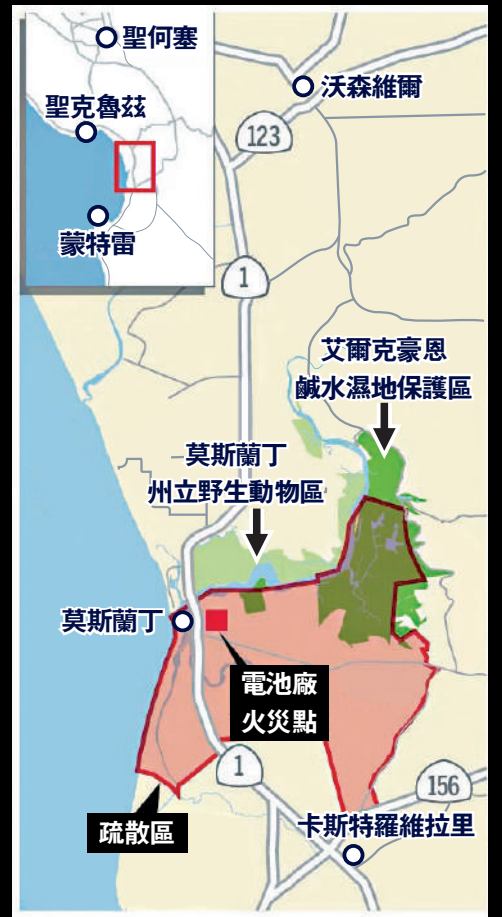
◀電池廠現場濃煙滾滾。