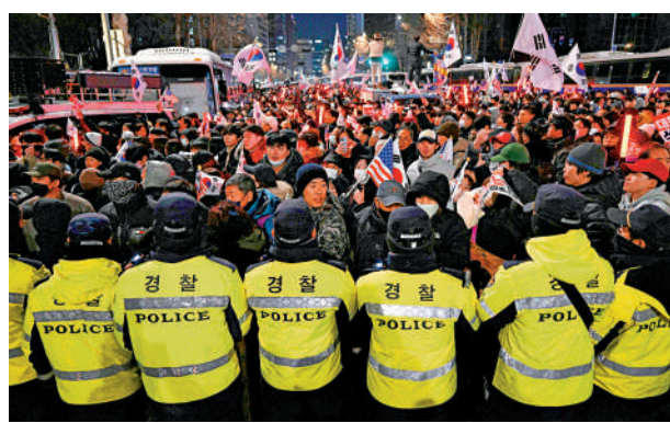
▲尹錫悅18日出席法院拘留令審查，韓國警察在法院外維持秩序。

統有權頒布戒嚴令，不構成內亂罪。審查期間，大批尹錫悅的支持者在法院外示威，其間有支持者衝撞法院大門，共有40人被警方拘捕。