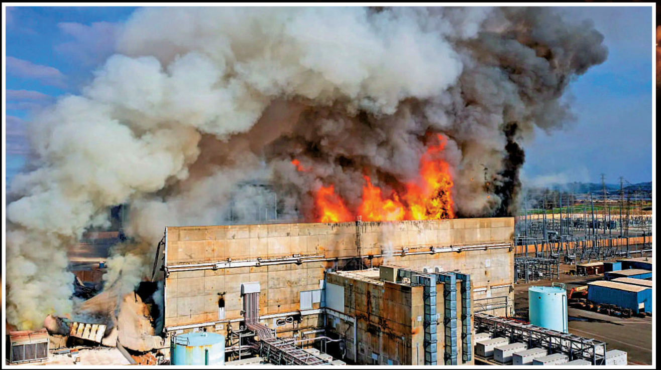
位於加州北部莫斯蘭丁的維斯達電池廠16日起火。

美國加州火災不斷。當地時間1月16日，北加州蒙特雷縣一座大型鋰電池儲能工廠發生大火，持續到18日未被完全撲滅。火災期間，電池廠冒出大量有毒濃煙，導致多達2000名居民被撤離，附近一條高速公路也一度暫時關閉。該電池廠是全球最大規模電池儲存基地之一，此次火災產生的危險毒氣恐對周邊數十萬居民產生影響，更可能加劇加州的能源危機。