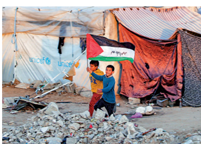
◀加沙難民營裏，一個男孩揮舞巴勒斯坦國旗。

不過，自15日協議達成以來，以軍加強對加沙地帶軍事行動，造成至少122名巴勒斯坦人死亡。另外，以色列中部多個地區18日響起防空警報，以色列國防軍發表聲明稱，一枚導彈從也門向以色列發射，已被以軍防空系統攔截。