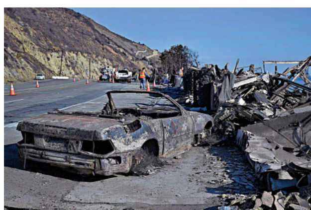
▲一輛汽車在洛杉磯山火中被燒毀。

洛杉磯縣地方檢察官霍赫曼當天宣布，再有9人被指控在山火中犯下各種罪行，包括縱火、搶劫和冒充消防員。據報道，這些案件將交由當地警察局負責調查，預計將在本月內進行預審。早些時候，洛杉磯警署於16日宣布，自山火出現以來，在山火災區