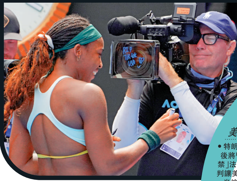
◀美國網球名將高美19日賽後在場邊攝像機鏡頭上寫下「安息吧，美國TikTok」。