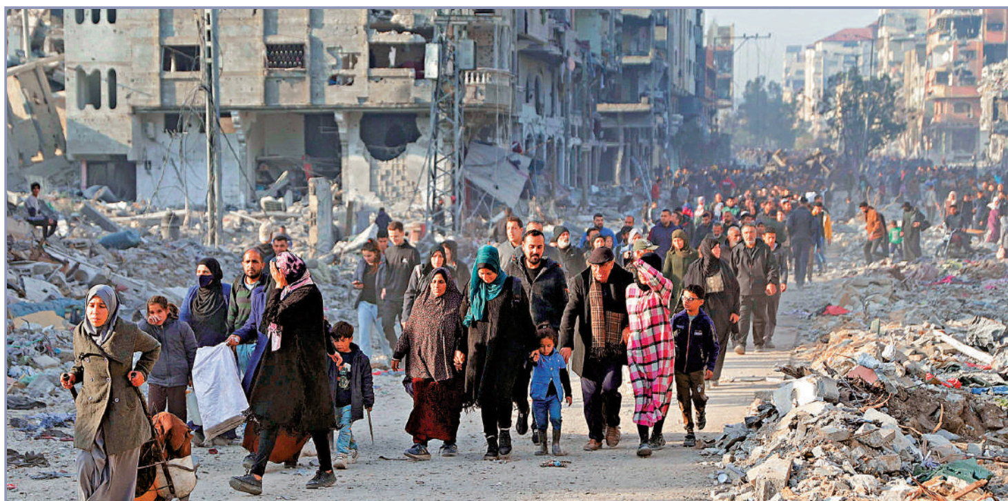
◀加沙北部流離失所的巴勒斯坦人19日重返家園。