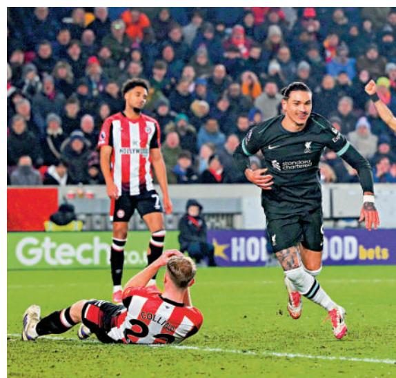
▲利物浦前鋒紐尼斯(右)後備上陣梅開二度。