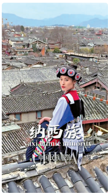
▲小紅書博主拍攝關於中國少數民族地區的視頻。