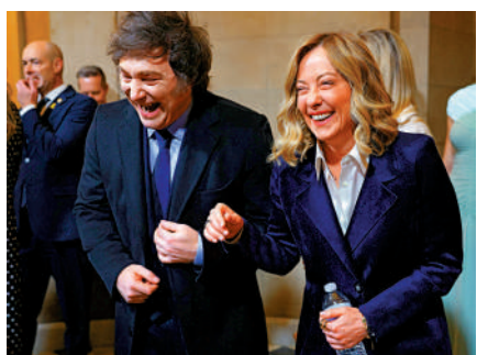
▲意大利總理梅洛尼（右）和阿根廷總統米萊在圓形大廳內。