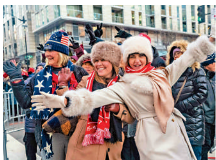
▲特朗普的支持者冒雪排隊，等待進入第一資本體育館。