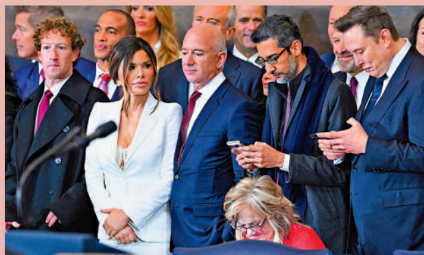
▲Meta創辦人朱克伯格（左一）、亞馬遜創辦人貝佐斯（左三）、谷歌CEO皮柴（右二）和Tesla創辦人馬斯克（右一）現場觀禮。