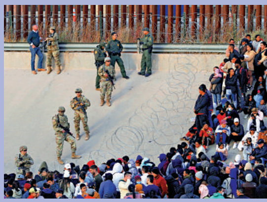
▲特朗普宣布美墨邊境進入「國家級緊急狀態」。