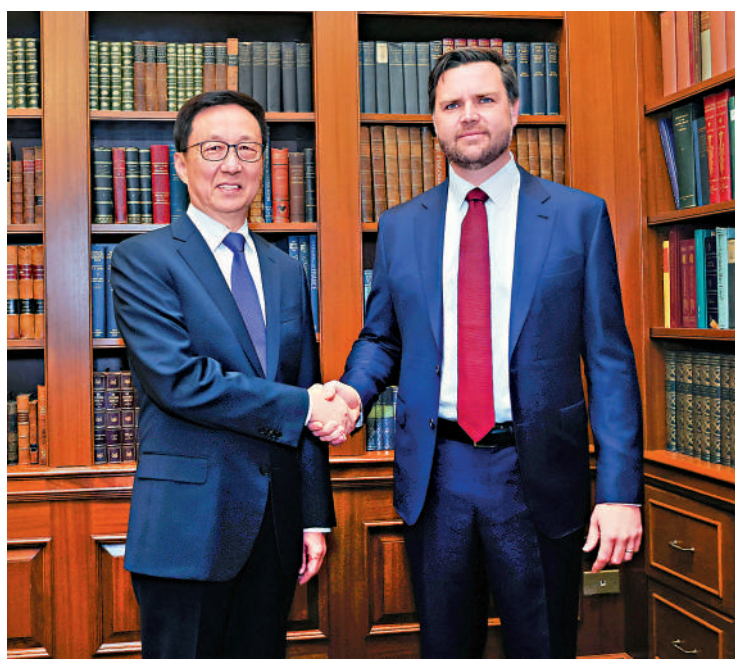
▲當地時間1月19日，習近平主席特別代表、國家副主席韓正在華盛頓會見美國當選副總統萬斯。