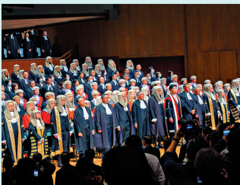
▲2025年法律年度開啟典禮昨日下午舉行。