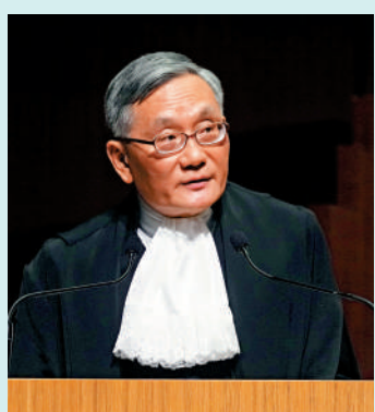
▲張舉能指出，個別法官的去留不會削弱法律制度的基礎和健全性。

張舉能指出，香港部分海外法官最近遭受有組織的滋擾和施壓，情況應受譴責。香港的法官訓練有素，經驗豐富，有能力維護法律，個別法官的去留不會削弱制度的基礎和健全性。律政司司長林定國指出，任何人威嚇法官或以任何方式干預相關司法程序，都不可能是真正關心香港的法治，強調特區政府會全力支持司法機構致力委任和保留外籍非常任法官的工作。