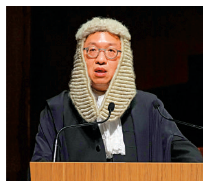
▲林定國強調，律政司會與業界合作，堅定維護和加強香港法治。

【大公報訊】2025年法律年度開啟典禮昨日舉行。律政司司長林定國致辭時強調，特區政府會繼續竭盡所能，善用香港的普通法制度，在本地和國際間維護和推廣和平、包容、開放、共享的重要價值理念。他指出，香港一向積極推動和促進以和平方式解決本地及國際糾紛，國際調解院將成為全球首個致力以調解解決種種國際糾紛的政府間國際法律組織，預計由舊灣仔警署改建的國際調解院總部可於今年年底開始運作。