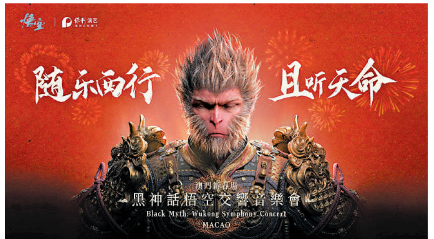
▲《黑神話：悟空》交響音樂會2月1日及2日於澳門美高梅劇院上演。

的沉浸式氛圍。作為中國遊戲的傑出代表，《黑神話：悟空》承載着深厚的傳統文化底蘊。《黑神話：悟空》交響音樂會將以一種全新的藝術形式，向全球傳播中國傳統文化。這個春節，不妨在2月1日和2日兩天的15:00、19:30，一同沉浸於《黑神話：悟空》交響音樂會之中，見證遊戲與音樂、東方與西方、傳統與現代融合的時刻。本次演出首度呈獻三首全新曲目，觀眾並可獲贈音樂會主題的精美豐富周邊禮品乙套，包括T恤、帆布袋及新春春聯等。