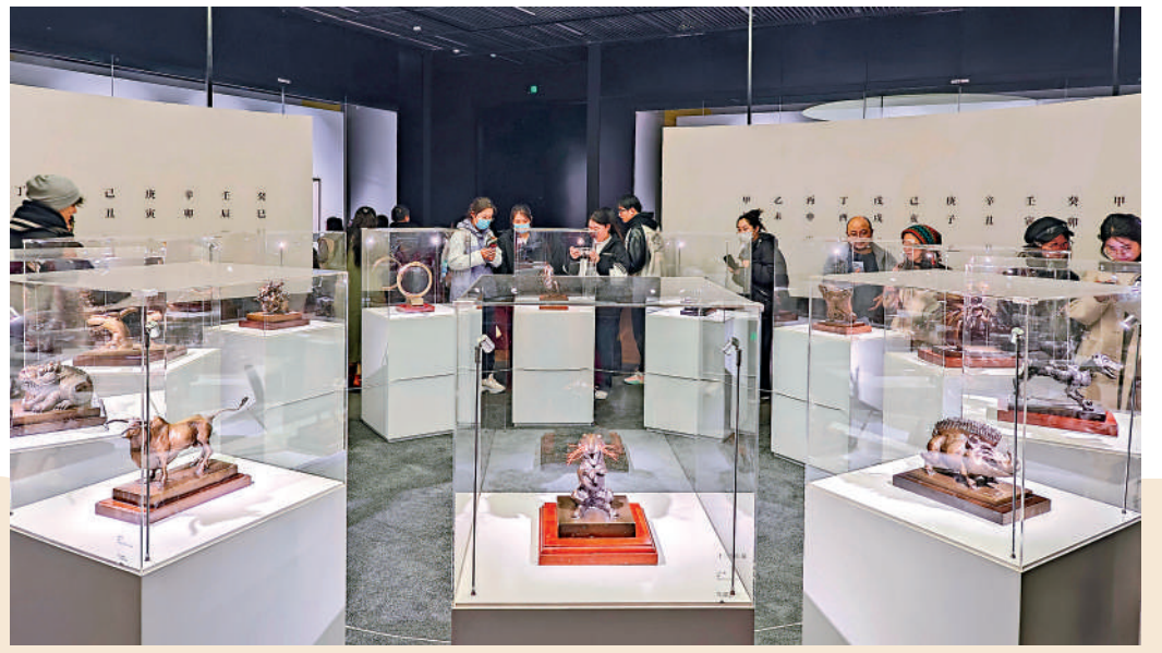
▲首次在巡展中全部亮相的十二生肖雕塑。