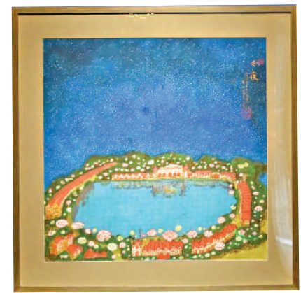
▲黃永玉在人生最後一個元旦節創作的《今夜》。