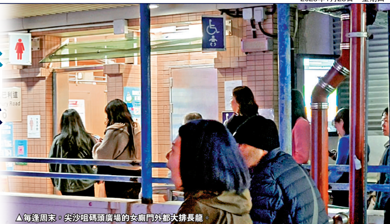
▲每逢周末，尖沙咀碼頭廣場的女廁門外都大排長龍。

商舖店員林先生認為現時商場人流主要是區內居民，但隨着社區發展，人流增加，廁所應開放。他提及南區要發展旅遊，屆時商場多了遊客購物，應該將廁所開放：「如果要方便遊客的話，當然要把廁所處理好！」商場管理公司回覆表示，商場廁所所有別於公廁，商廁因為上鎖而會較衛生及乾淨，而市民或遊客都可向商舖借廁所鎖匙，上鎖的廁所亦變相等於對外開放。