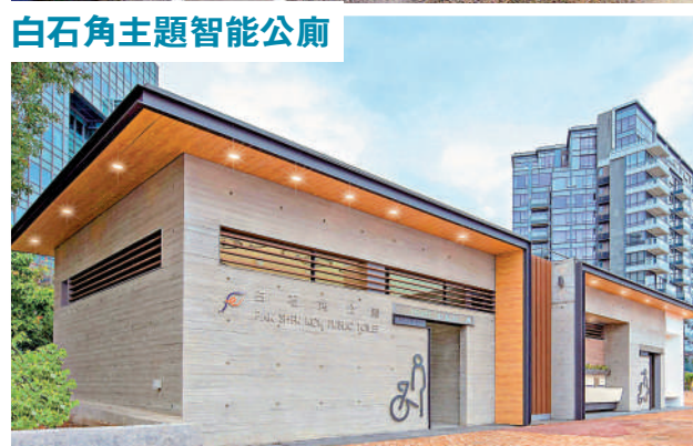
▲專家建議增設更多智能公廁，改善市民和旅客如廁不便的問題，更強烈建議推行「男女共廁」。