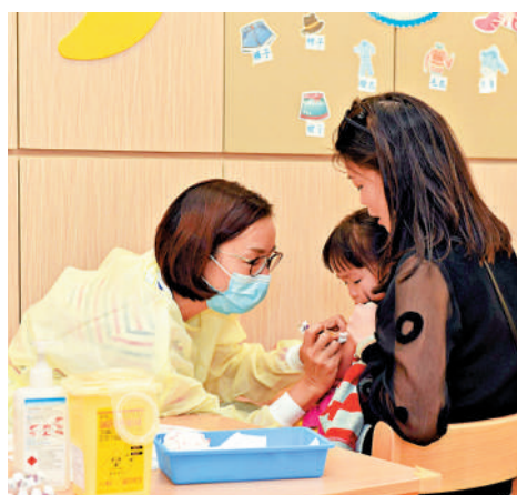
▲東華三院參與學校外展流感疫苗接種計劃，派出醫護團隊為屬校學生接種疫苗。

衛生防護中心重申，歡迎所有學校參與季節性流感疫苗學校外展計劃或疫苗資助學校外展計劃，接種學童的人數不限。中心敦促仍未提供確定接種日期的學校，盡快安排接種。