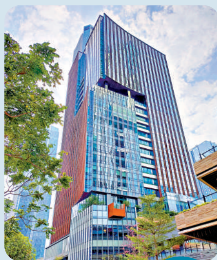
▶滙豐前海新辦公大樓總投資超過40億元人民幣。