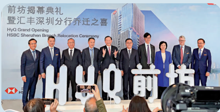
▲滙豐設於深圳前海的新辦公大樓「HyQ前坊」揭幕儀式昨日舉行。