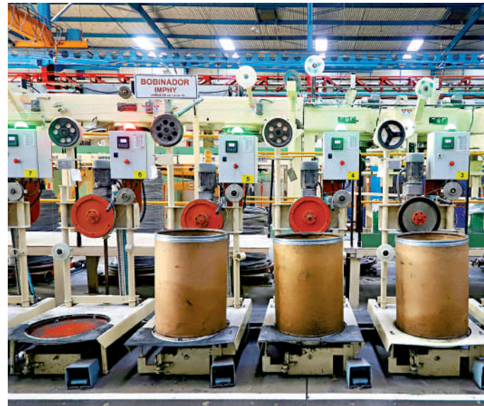
▲特朗普計劃從2月1日起對從墨西哥進口的商品徵收25%的關稅。圖為墨西哥一家向美國出口不銹鋼線、鉛等金屬製品的企業廠房。