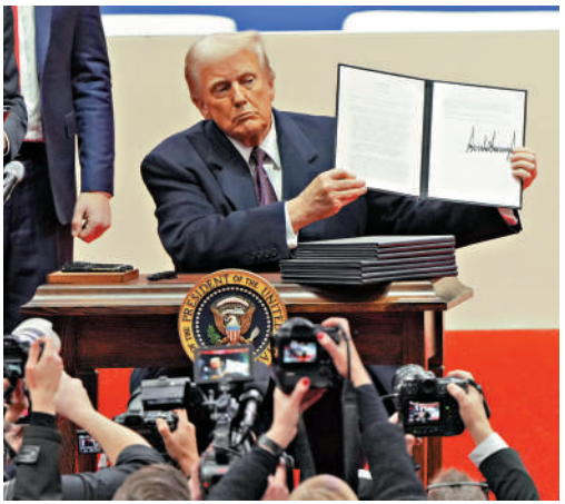
▲特朗普上任後即密集簽署行政令。

分析指，若特朗普一意孤行，加徵關稅可能引發全球多國與美國之間的貿易戰，增加的成本將轉嫁給美國進口商和美國消費者，最終反噬自身。（綜合報道）