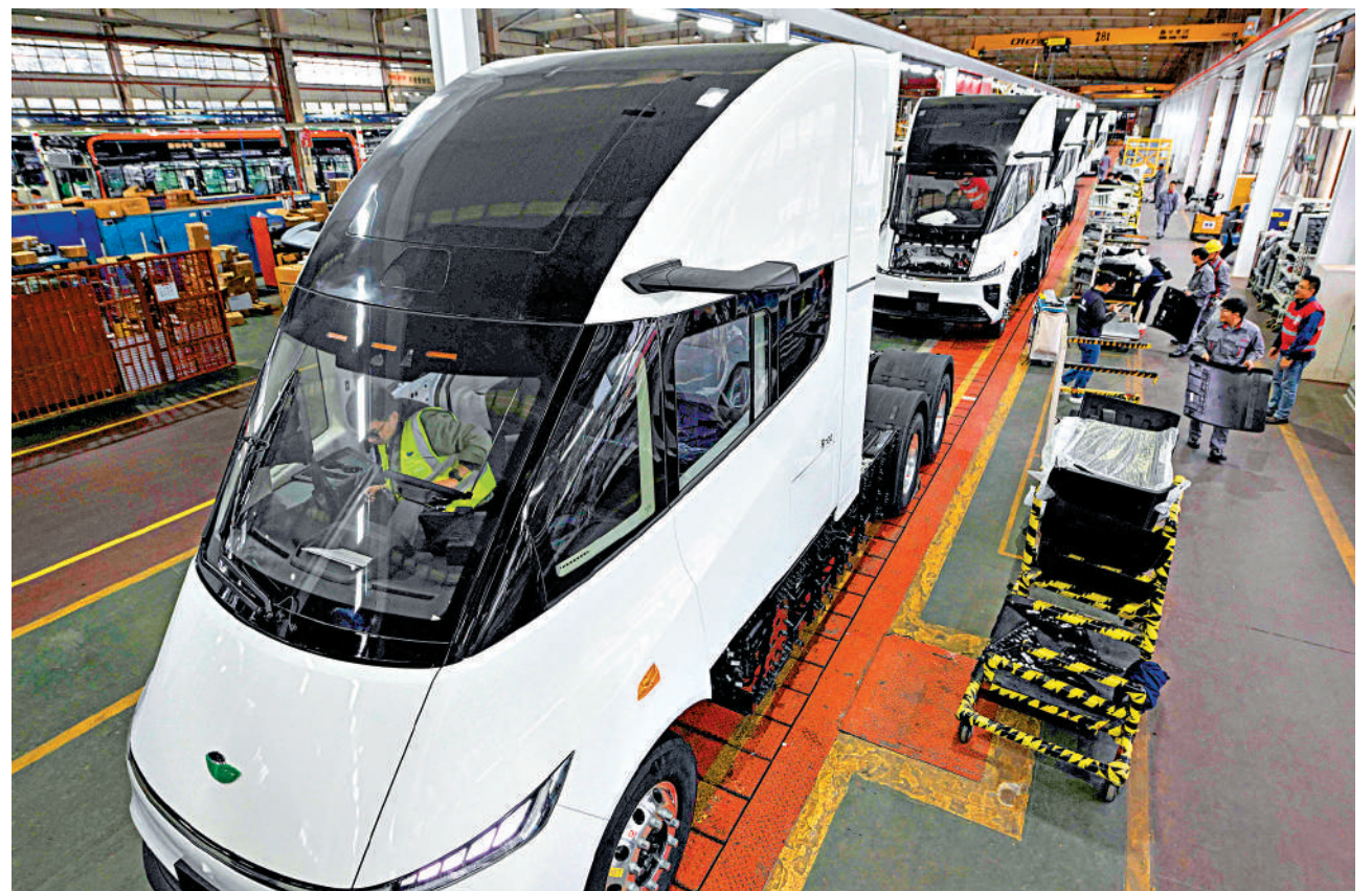
▲特朗普揚言對進口的中國商品加徵10%的關稅。圖為中國江蘇一家電動貨車工廠的組裝生產線。