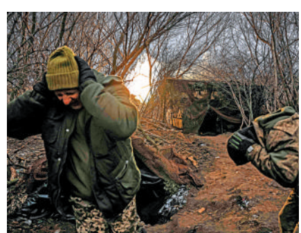
▲俄烏停火談判暫未有新進展。

普京20日在與俄安全會議成員召開會議時稱，俄方願與美國政府就烏克蘭局勢進行對話。他指出，就烏克蘭局勢，目標不應該是短暫的休戰，而應該是「在尊重該地區所有人員和國家合法權益基礎上的長期和平」。