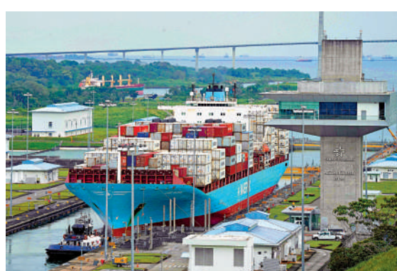
►一艘丹麥貨輪駛過巴拿馬運河的船閘。

就特朗普相關言論，中國外交部發言人毛寧22日表示，中方認同巴拿馬總統穆利諾所說，巴拿馬的主權和獨立不容商討，運河不受任何大國直接或間接控制。中方沒有參與運河的管理運營，從不插手運河事務，一貫尊重巴拿馬對運河的主權，承認運河為永久中立的國際通行水道。