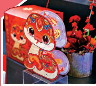
▶歡樂春節吉祥系列——生肖蛇提燈。