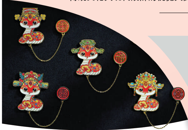
▲歡樂春節吉祥系列——生肖蛇福祿壽禧財徽章。

「歡樂春節」是由文化和旅游部在海外精心打造的全球聯動文化品牌。20餘年來，正逐漸成為全球共慶共享的文化嘉年華。「歡樂春節吉祥蛇」系列將被廣泛應用於2025年「歡樂春節」品牌活動中，為全球的中國春節慶祝活動帶來新元素、新亮點。據悉，「歡樂春節吉祥蛇」系列由中國對外文化交流協會授權，中國旅遊集團投資和資產管理有限公司旗下北京《旅行家》雜誌社進行開發運營，其原型設計由中央美術學院設計學院副院長林存真團隊領銜完成。