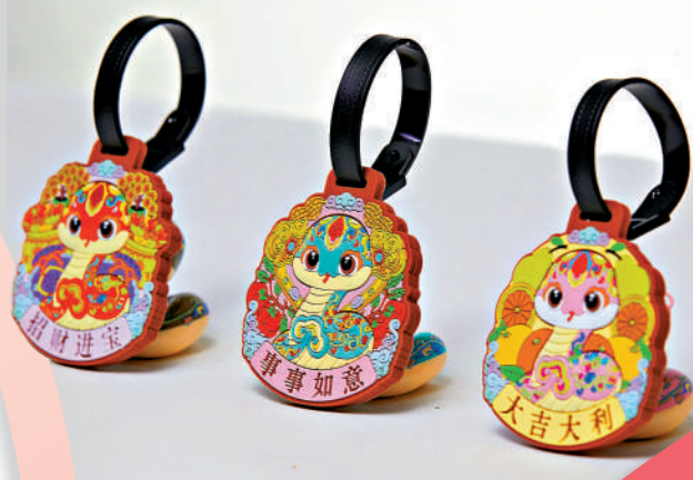
▲歡樂春節吉祥系列——生肖蛇行車牌。

皮感；在蛇身上使用了傳統吉祥紋樣，並進行簡化創新，使之與蛇的整體流線造型相呼應，增加了吉祥寓意。同時，選用六件瓷器文物中的中國傳統色彩，包括丹赤、緋櫻、赤金、碧青、紺青和黛藍六色，為「吉祥蛇」披上了喜慶吉祥的綵衣。」她說，運用這些綜合的設計和表現手法，來呈現出一個喜氣洋洋、靈動可愛且具有國風感的吉祥物形象，比較貼合現代年輕群體的喜好。