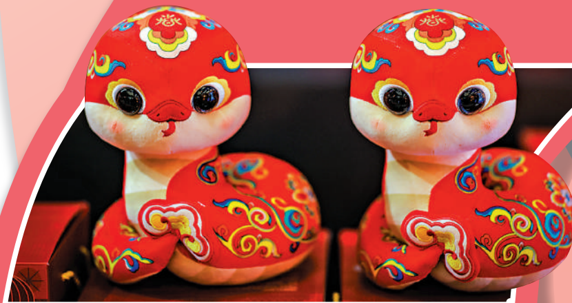
▲歡樂春節吉祥蛇玩偶。