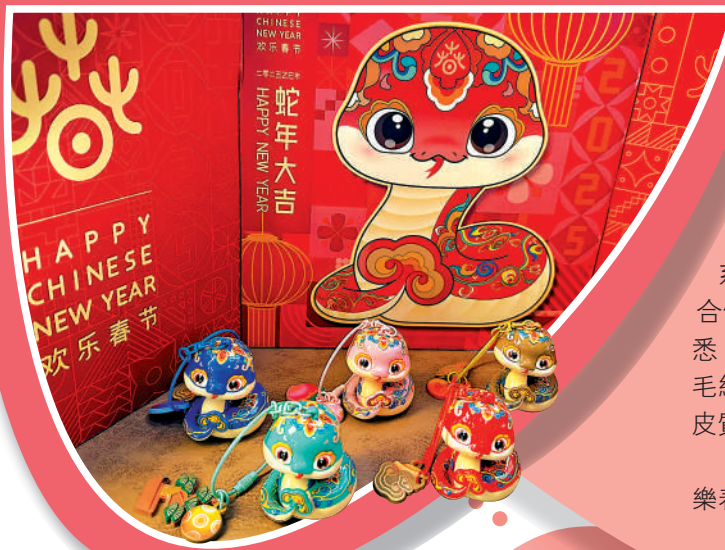
▼歡樂春節吉祥系列——生肖蛇鑰匙扣。