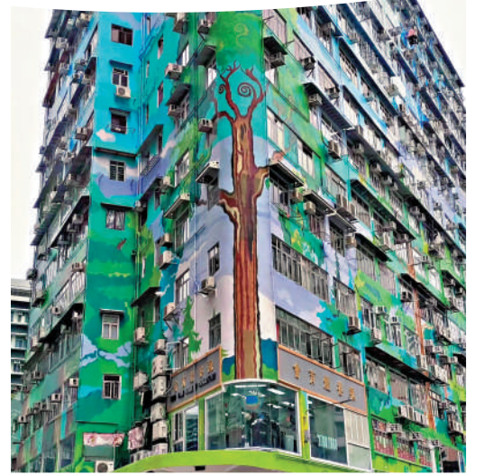
▲長寧大廈外牆畫作的主题是「森林」。

烈。」未來，陸海天計劃將這些創作進一步擴展，將外牆畫作轉化為香港文化的象徵。他說：「我曾在一些香港地標內融入一些具有象徵意義的元素，比如仿古帆船，或是與香港文化相關的名人形象等。」然而，陸海天坦言，這些創意的實現需要相關方的同意，但他相信它們能為香港的文化傳承增添一份獨特的色彩。