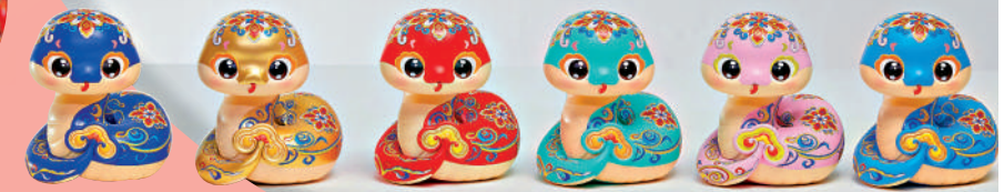
▼歡樂春節吉祥系列——生肖蛇盲盒。