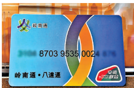
截至2024年12月，嶺南通、八達通交通卡累計發行超過6.25萬張。