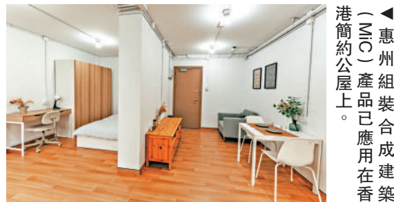
惠州組裝合成建築（MiC）產品已應用在香港的公屋上。