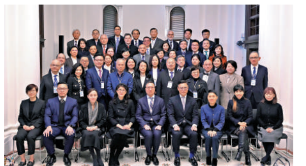
▲14日，香港律政司舉行儀式為來自香港的粵港澳大灣區調解員頒證。