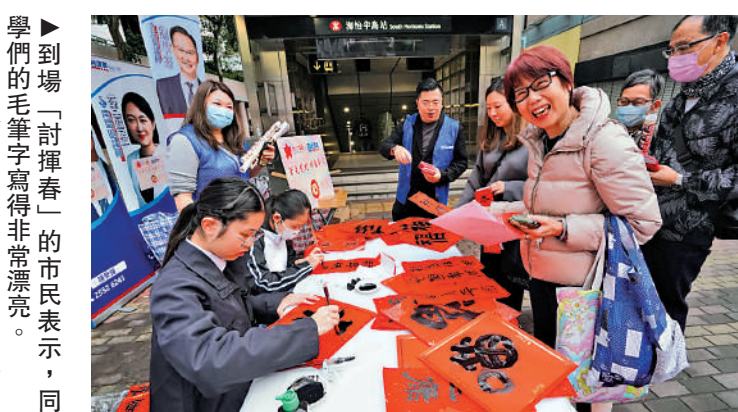
▲到場「討揮春」的市民表示，同學們的毛筆字寫得非常漂亮。