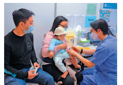
▲四間指定母嬰健康院今日起停止接受婦女健康服務的新症預約。

此外，中西區地區康健站會擴充為康健中心，其主中心設於德輔道中308號，總面積約1000平方米，預計第三季投入服務。