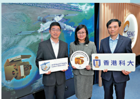
▲科大研究團隊領軍研製全球首款輕小型高分辨率高精度的二氧化碳和甲烷點源協同探測儀載荷。

▲科大牽頭研製的探測儀載荷，有望成為香港特區首項跟隨天舟貨運飛船登上中國「天宮」太空站展開研究與應用的載荷。 科大示意圖