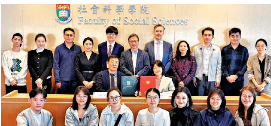
▲香港大學與北京大學簽署合作備忘錄，推出全新兼讀制公共行政學碩士課程。

為滿足這一需求，港大社會科學學院與北京大學政府管理學院合作推出全新的兼讀制公共行政學碩士課程。該課程讓學生在香港和北京兩地進行強化模式學習，為期兩年，計劃於2025年9月正式實施。兩所高校還將在可持續發展、研究、學術交流以及學生互動等領域展開合作。