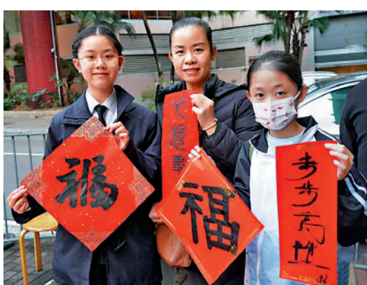
▲趙太太的兩個女兒參與了昨日的寫揮春活動。大公文匯全媒體記者曾興偉攝