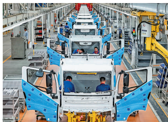
▲美國會操弄中國最惠國待遇議題。圖為工人在中國江蘇一家比亞迪車廠工作。

中國外交部發言人毛寧24日表示，中美經貿合作是互利共贏的，中國從不刻意追求貿易順差。儘管中美之間有分歧和摩擦，但是兩國的共同利益和合作空間是巨大的。雙方可以就此加強對話和協商。毛寧稱，貿易戰、關稅戰沒有贏家，不符合任何一方利益，也不利於世界。