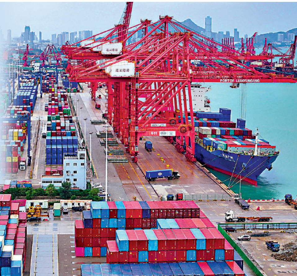
▲特朗普四處揮舞關稅大棒。圖為中國江蘇省連雲港港口的大批集裝箱。

美國總統特朗普23日在達沃斯世界經濟論壇2025年年會上發表視頻演講。他向全球企業喊話，稱如果不在美國生產商品，就將面臨「數千億甚至數萬億美元」的關稅；又敦促石油輸出國組織（OPEC）降低石油價格，要求各國降息。世貿組織總幹事伊維拉警告，特朗普的關稅威脅引發的貿易戰將對全球經濟增長造成災難性後果。美媒援引前英國外相利班德稱，特朗普上任僅三天，已顯示「破壞者」本色。