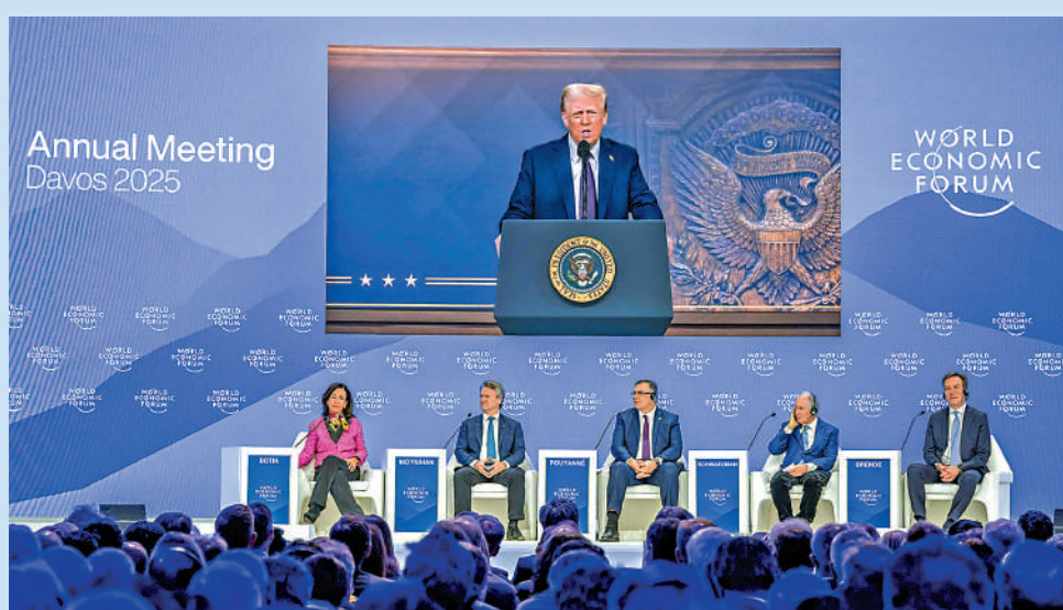
▲美國總統特朗普23日在達沃斯論壇發表視頻演講。