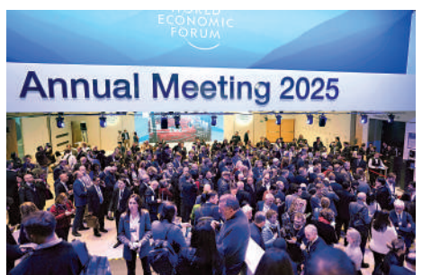
▲達沃斯論壇現場人頭攢動。美聯社

特朗普當天發出的「指令」遠不止關稅威脅。他稱計劃大規模干預世界石油市場，並呼籲沙特等OPEC國家降低石油價格，他還驚訝這些國家沒有在去年11月美國大選前就這樣做。他表示，只要油價下跌，就可以向俄羅斯施壓，俄烏戰爭就會立即結束，某種程度上，