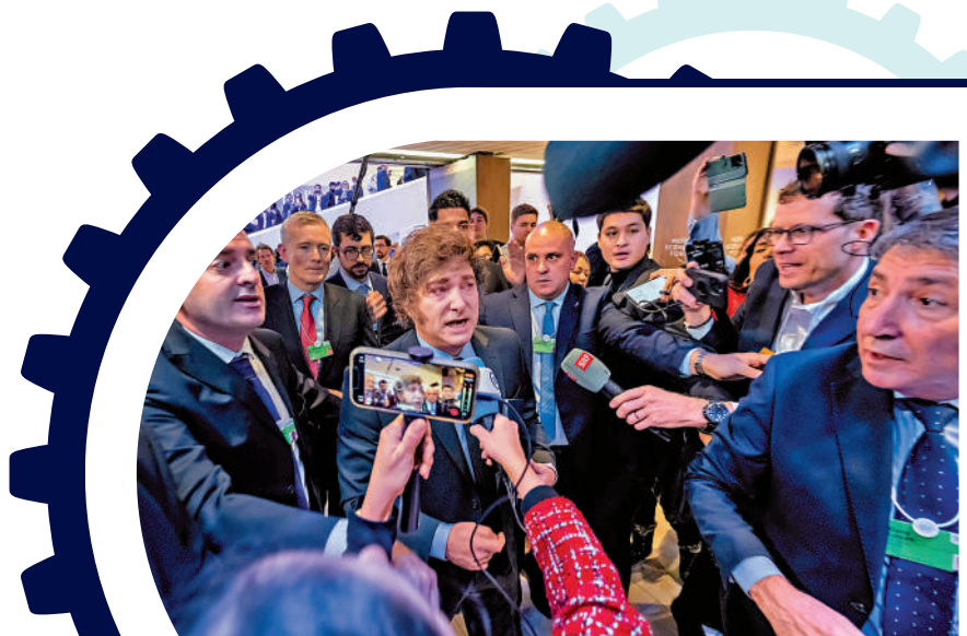
▲ 阿根廷總統米萊（中）23日在達沃斯論壇受訪。