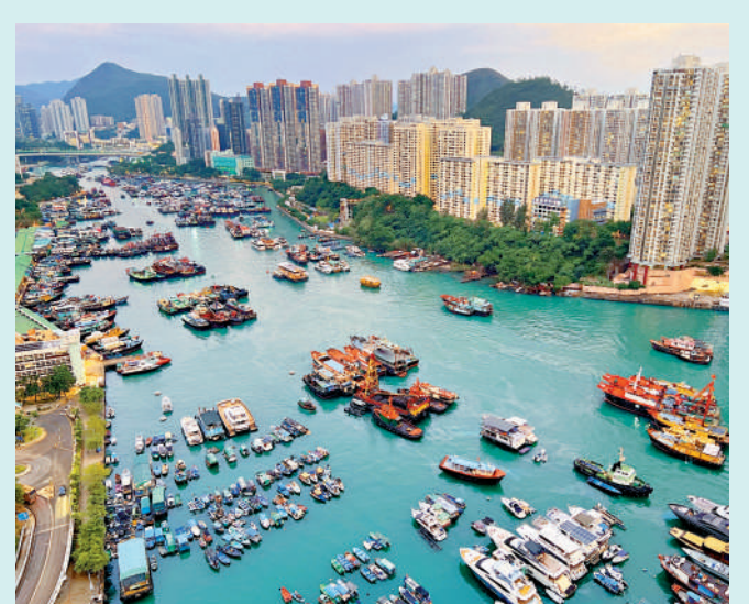
▲南區旅遊資源豐富，議員認為有發展遊艇旅遊的天然優勢。圖為香港仔避風塘。