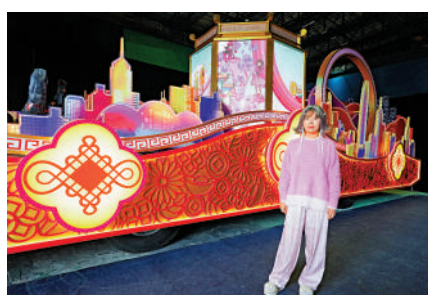
▲旅發局花車昨日率先亮相。

目，香港新春的中西元素多元，她在設計前搜集資料和訪問香港朋友，由設計到落實大約花費一個月。她說最滿意花車上的如意結的設計，她用了一個很誇張的尺寸來展現如意結，用一個紐帶，連接賀歲馬、林村許願樹等四個場景，形容是搭檔構圖。她亦很喜歡其中的舞獅場景。她說小時候在內地生活，現時在美國定居，已有數年沒有回內地和家人過年。這次是她首次在香港過年，媽媽亦會來港共度佳節，她打算去逛年宵市場，參觀花車巡遊，體驗香港的新春活動。