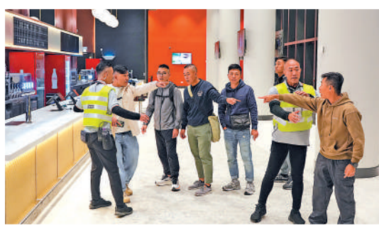
◀應對醉酒生事者亦是演練的一個環節。

陳國基並希望參與演練的觀眾積極填寫調查問卷，並且期望各個相關單位繼續通力合作，做好未來啟德體育園的運作。