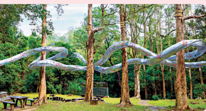
▲藝術裝置《風的流動》位於大城石澗石橋。

到達位於山頂處的城門水塘觀景台，上城門水塘的壯麗景色躍現眼前。觀景台可180度飽覽自然與都會融合的景致，近景是環繞城門水塘的山麓輪廓，遠方則能看到葵涌區的城市天際線。之後便可登城門水塘主壩，欣賞獅子山和大帽山的絕美山景。