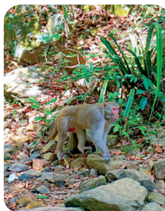
▲沿途或會偶遇猴子。

位於大帽山和金山郊野公園之間的城門水塘，是親子登山郊遊的好去處。水塘附近一帶蝴蝶紛飛，還有猴子、黃牛以至野豬的身影。沿着水塘道或教育徑漫步，無論身處山麓水波之間，或是深入白千層樹林，都能拍出漂亮的打卡照。