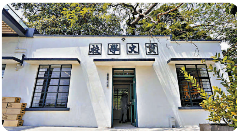
▲修復後的貫文學校變成展覽空間。

「迴音川龍」攝影展覽 ●展期：即日起至2月28日 ●地點：荃灣川龍村338荃錦公路