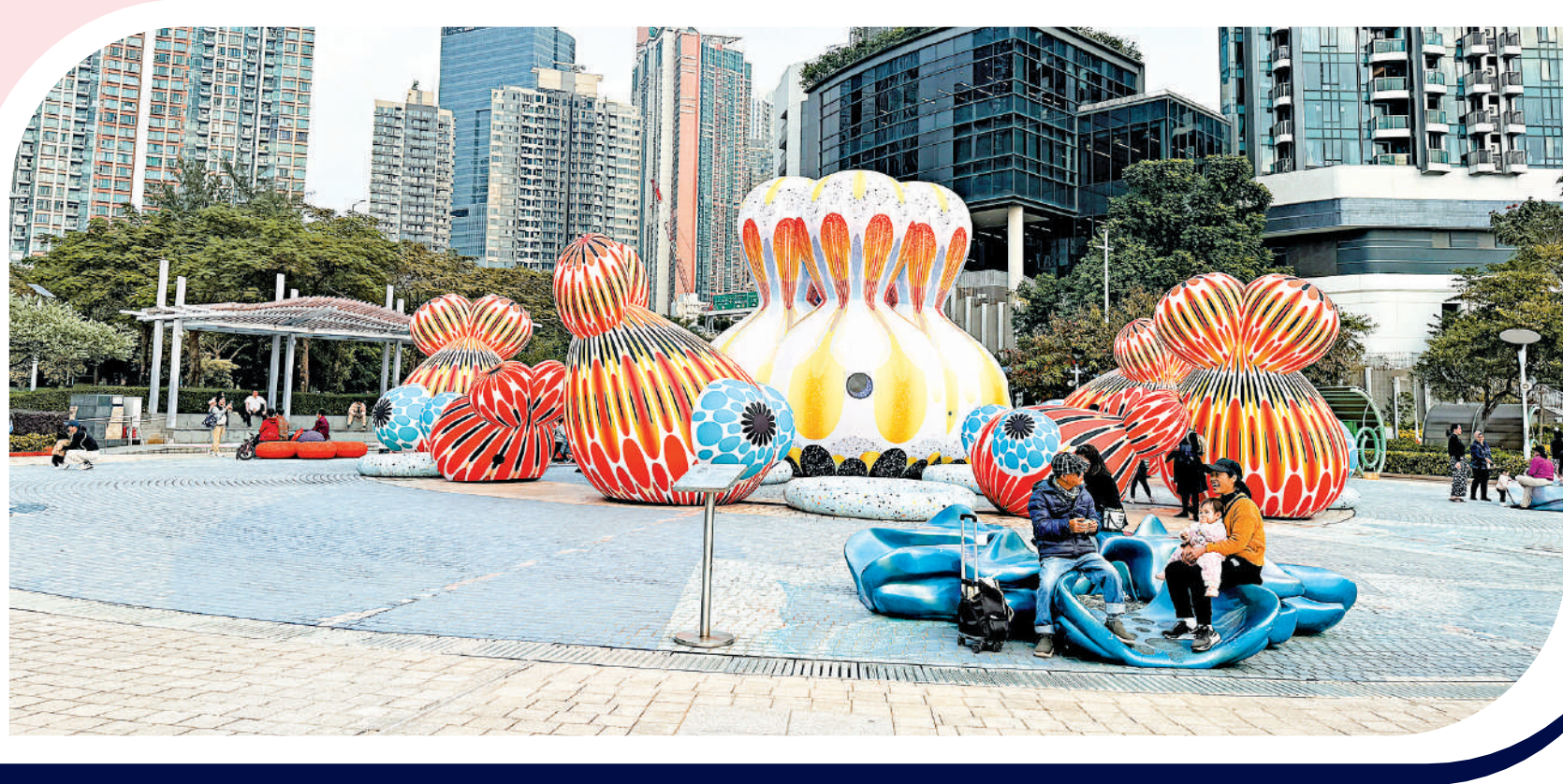
市民在《幸福丘比特遊園》裝置前休憩。