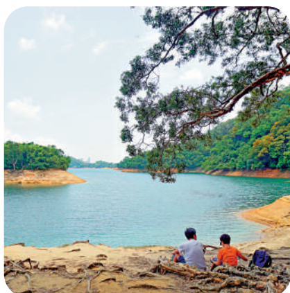
▲城門水塘是親子郊遊好去處。