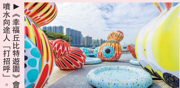
噴水向途人「打招呼」。會