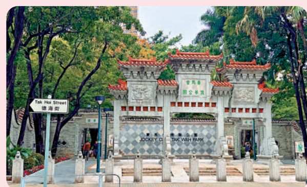
▲位於德海街的賽馬會德華公園。

路德圍一帶美食小店林立，不少市民和遊客來此處覓食。港式茶餐廳、粥店、車仔麵店、豆腐花、雞蛋仔等應有盡有。