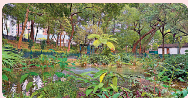
▲三棟屋花園內的池塘。