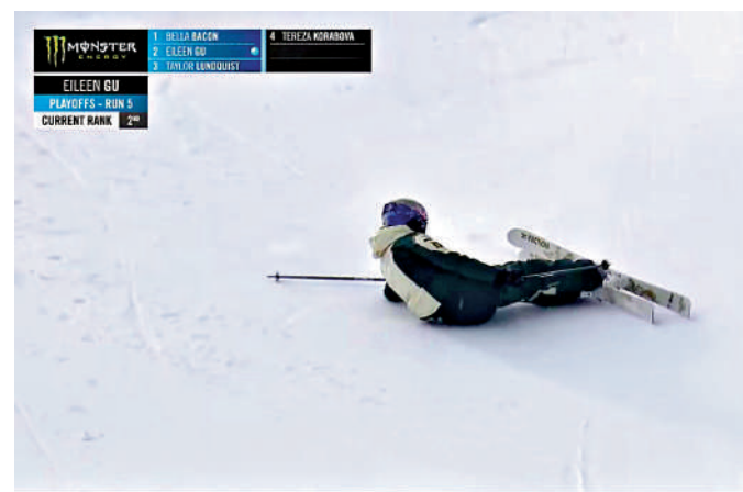
▲谷愛凌在自由式滑雪街式比賽中失誤滑倒。

組委會提供賽事保障車輛1090台，從機場到酒店、從酒店到場館均安排了專用班車，所有線路均預設了應急備用車輛。賽會精選智能精品車型，針對亞冬會低溫環境。在智能出行保障方面，合作方吉利控股集團通過時空道宇運行的出行星座，為亞冬會車輛的精準調度、定位、導航、通訊與安全運行保駕護航。