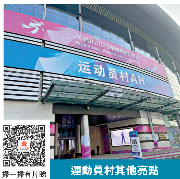
運動員村其他亮點