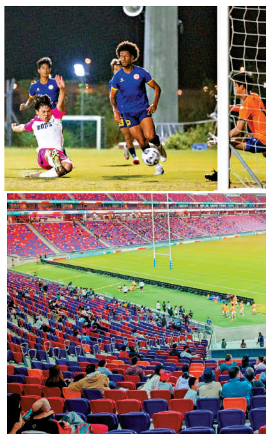
▲啟德主場館2月4日將舉行首場足球測試賽。

公務員事務局局長楊何蓓茵昨天在個人社交平台上發帖文，表示總結了剛過去周五晚的測試活動情況，她透露參與人數為3個場館上限