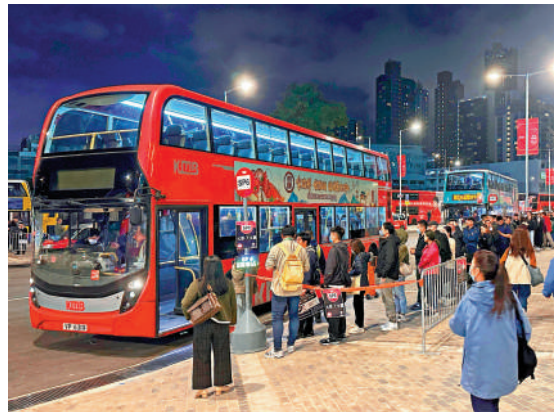
▲測試賽期間將加密港鐵班次及加開特別巴士路線。

運輸及物流局局長陳美寶昨天於電台節目中亦指出，在這次啟德體育園最大規模的測試活動中，在加密港鐵班次及加開特別巴士路線下，人流散場時間符合預期，45分鐘便已經可以完全消化人潮，大型疏散演練效果理想，流程順暢。