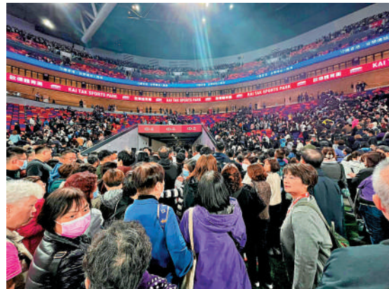
啟德主場館周五晚順利演練5萬人有序離場。

賽後第二場體育測試賽，亦是首場足球測試賽。當局預料會有50000名觀眾入場，意味着將坐滿主場館。