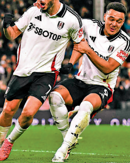
富咸前鋒魯爾占美尼斯(左)。