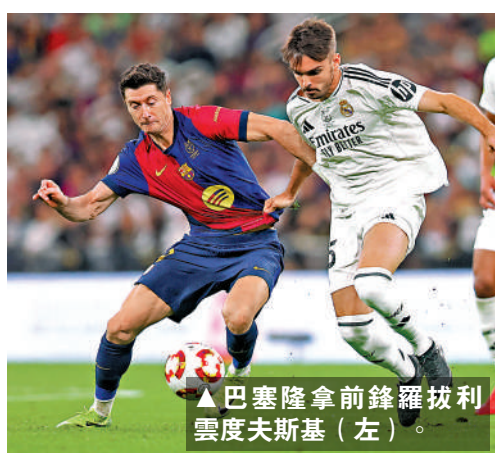
巴塞隆拿前鋒羅拔利雲度夫斯基(左)。