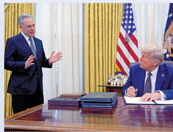
1月23日，特朗普在內閣與其加幣政策顧問薩克斯(左)交談。

特朗普已提前規避法律風險。「特朗普幣」官網列明免責條款，聲稱這只是一種支持特朗普的「數碼收藏藝術品」，而非「投資機會、投資合約或任何證券」。特朗普21日在內閣稱，除了宣布發行外，他對該幣「知之甚少」。(綜合報道)