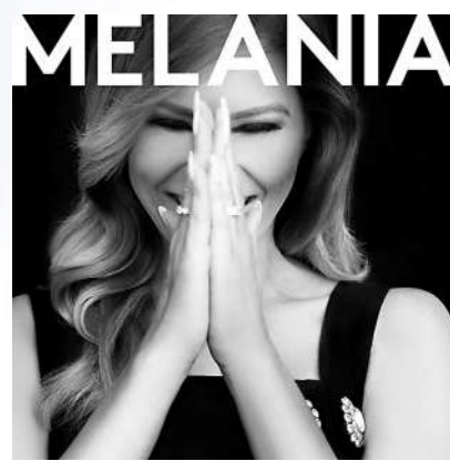
1月20日，特朗普妻子梅拉尼婭推出個人迷因幣$MELANIA。