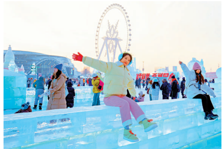
▲哈爾濱成冰雪遊最受歡迎的目的地，熱門景區酒店爆滿。