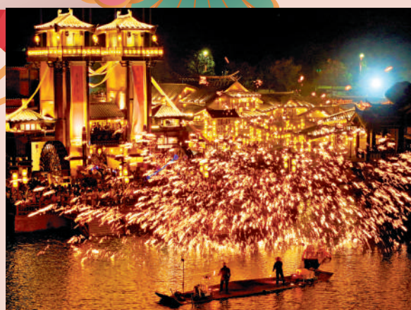
▶ 非遺技藝「打鐵花」營造濃郁的節日氛圍。新華社

文化觀瀾 「小孩小孩你別饒，過了臘八就是年。」臘八節之後，年味越來越濃。街市上大紅燈籠和中國結多起來，走進商場，萌態可掬的蛇年吉祥物、紅底金色的「福」字透出春節氣息。對於中國人而言，春節是一年中最重要、最盛大的節日，滲透在生活中的春節民俗集中反映了中國人對美好的嚮往、對人倫的守護、對親情的珍視。