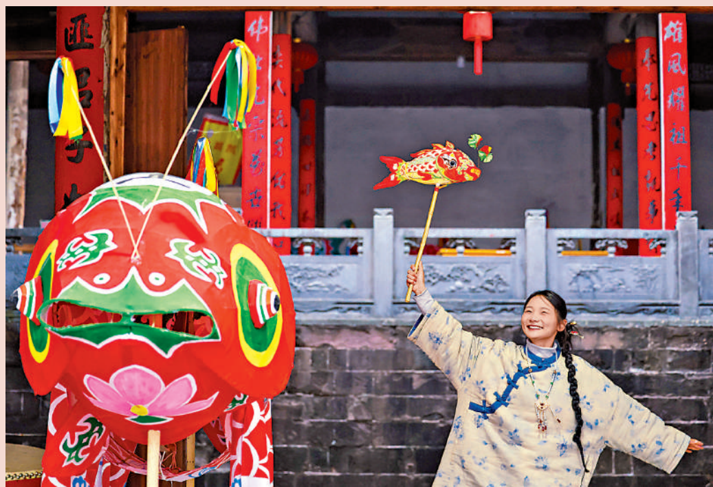
◀ 在安徽省黃山市歙縣北岸鎮瞻淇村，遊客手持非遺魚燈，迎接新年的到來。新華社

民俗說到底是人與人交往關係的文化形態。凡是對社會生活、人際交往產生深刻影響的科技成果總是刷新民俗的面貌。春節民俗既是古老而豐富的，又是活態而開放的。從傳統走向現代的進程中，現代文化活動、生活