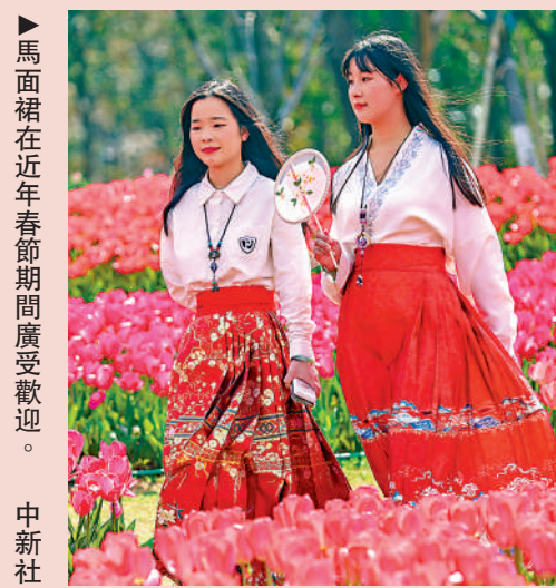
▶ 馬面裙在近年春節期間廣受歡迎。

在其中汲取新的營養，充實文化內涵，革新文化形態，產生更具感染力的文化效果，給所有喜愛春節的人送去祝福和歡樂。