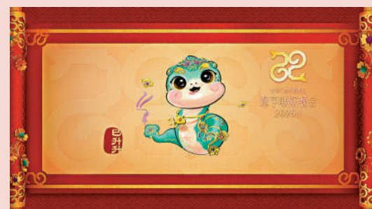
▲ 2025年蛇年春晚吉祥物「巳升升」。

在其中汲取新的營養，充實文化內涵，革新文化形態，產生更具感染力的文化效果，給所有喜愛春節的人送去祝福和歡樂。