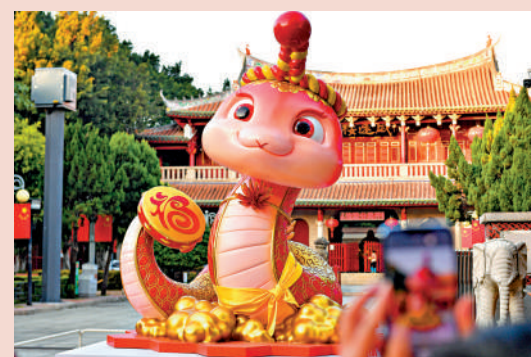
▲ 福建泉州威遠樓前的蛇年生肖IP「七彩刺桐蛇」藝術裝置融合閩南文化、非遺元素。