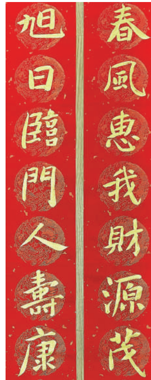
作者：戴武，中國書法家協會篆刻專業委員會委員，中國藝術研究院篆刻院研究員，西泠印社理事，安徽省人民政府文史研究館館員。