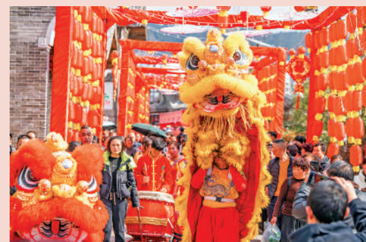
▲ 春節期間的舞獅表演。

一個時代有一個時代的民俗。國風和科技可謂當代春節民俗最重要的兩大加持力量。前者以植根於傳統文化、中華美學又融入現代生活時尚追求的獨特魅力，彰顯了春節民俗的文化根脈及當代價值。後者則通過對文化傳播媒介以及人際互動方式的深刻變革，促使春節民俗迭代更新，設置接入現代生活、體現當下訴求的更多端口。國風和科技的加持，使春節這個傳統節日的文化底蘊與時代新韻交相輝映，更契合當下人們對美好幸福生活的需求。同時也充分說明，春節民俗不是封閉的系統，更不是一套行禮如儀的「規定動作」。作為中國文化價值理念的集中體現，春節民俗具有足夠的包容性，它向着時代和未來敞開，可以與一切科技新成果、文化新業態、時尚新潮流積極對話、攜手並進，並