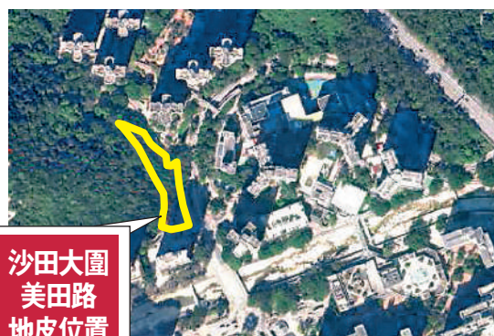
沙田大圍美田路地皮位置

地政總署昨日公布，位於大圍美田路沙田市地段第651號用地，由新地旗下萃恒有限公司，以最高標價6.06億元投得。以該地最多可建樓面約19.38萬方呎計，每呎樓面地價約3128元。市場之前對該地的估值介乎5.8億至6.4億元，而特區政府預計此地可建約360個單位。