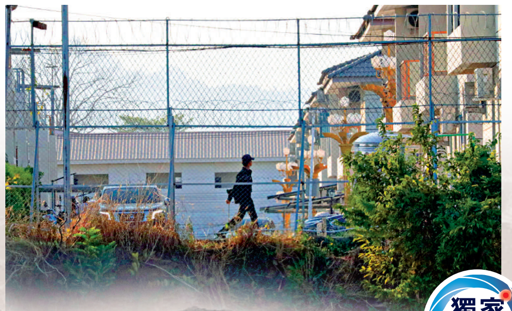
▲大公報記者此前在現場發現，KK園內有疑似軍人巡邏。