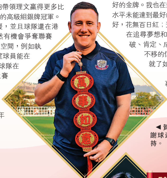
◀賀蘭特感謝球迷熱情支持。

最後，我祝願各位球迷新年快樂，萬事如意，亦希望球隊越來越好，明年球場上我們再見！