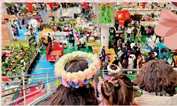
▲戴個花環逛花市成為來昆明的遊客「打卡必備」。