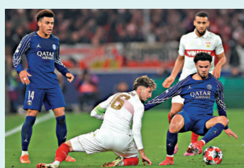
▲聖日耳門（藍衫）首階段只有4勝1和3負戰績。

被列為奪標熱門之一的曼城，竟然要戰至最後一輪才挽回出局厄運；今季有麥巴比離隊的巴黎聖日耳門也一度跌至「出局區」，幸適應最後3輪都大勝而回；萊比錫首6戰全敗成首支出局球隊之餘，亦是唯一出局的首檔次球隊，令人失望。