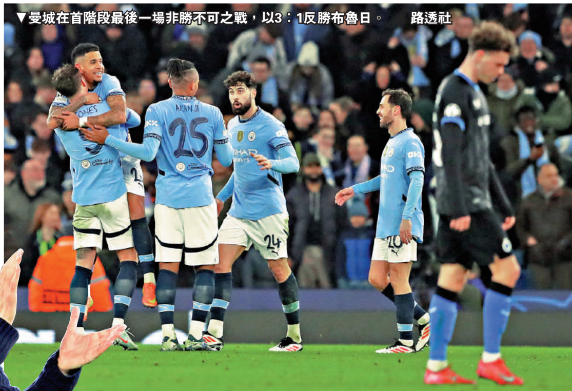
▼曼城在首階段最後一場非勝不可之戰，以3：1反勝布魯日。