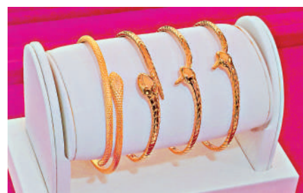
為慶祝農曆蛇年，蛇元素設計的金飾銷售火熱。

得過的品牌與渠道購買黃金，尤其是紀念類產品，要留意是否具備收藏和投資價值。「現在市場上有些純粹是工藝品，更多是炒作概念。」