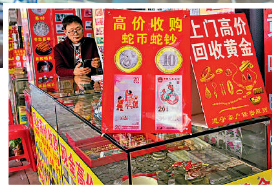
廣州西門口的收藏品市場，幾乎每個檔口都掛上「高價收購蛇幣蛇鈔」廣告牌。