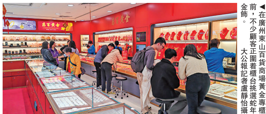
在廣州東山百貨商場黃金專櫃前，不少顧客正圍着櫃檯挑選蛇年金飾。