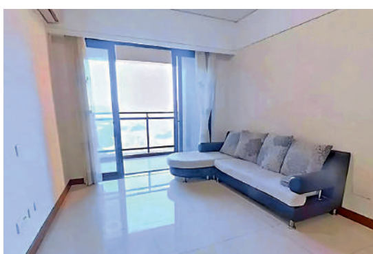
▲仁恒巒山美地戶型南北通透，採光充足。

在教育配套方面，仁恒巒山美地周邊有巒山美地幼兒園、海麗達卓雅幼兒園、陽光橡樹園幼兒園等優質幼教資源，以及寶龍科技城實驗學校（集團）碧新小學、寶龍學校、龍城高級中學等中小學教育資源。