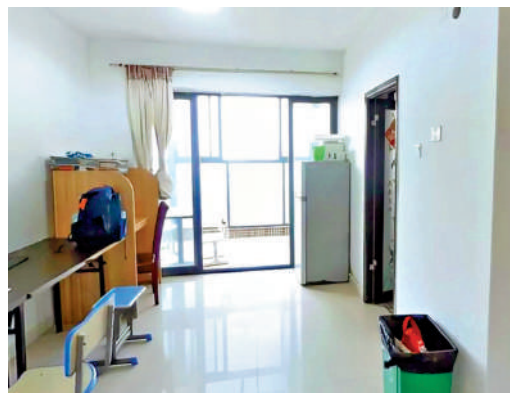
▲振業巒山谷單位面積由53至170平米，間隔一房至四房。