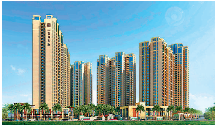
▲仁恒巒山美地為寶龍街道的高端住宅，提供近千五百個單位。