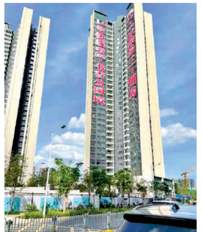
▲卓弘高爾夫雅苑為高層住宅。