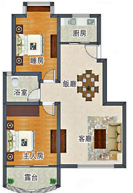
▲振業巒山谷56平米兩房兩廳戶型圖。