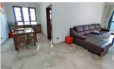
▲卓弘高爾夫雅苑戶型設計舒適實用。

卓弘高爾夫雅苑戶型相對較大，包括76平米三房、119平米四房、173平米五房等，戶型設計合理。屋苑附近環境優美，有龍崗植物園、高爾夫球場及國家森林公園。同時，屋苑配置游泳池、網球場、兒童樂園等休閒設施，為居民的業餘生活增添了無限樂趣。