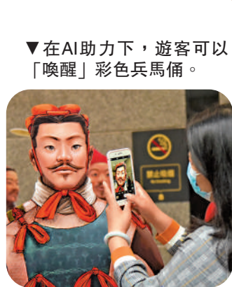
在AI助力下，遊客可以「喚醒」彩色兵马俑。