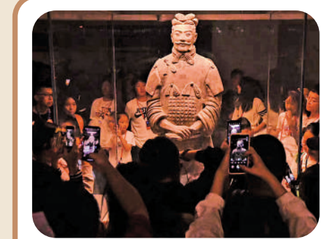
遊客在兵马俑觀賞「將軍俑」風采。

目前已發掘的兵马俑一、二、三號坑，出土大量陶俑、陶馬，以及青銅車馬、石甲冑、百戲俑等重要文物。如今在秦始皇帝陵博物院，遊客不僅可以在帝陵前漫步遐想地宮內震撼的「寶石天穹」、「水銀江河」，同時在兵马俑坑旁邊可以動動手，讓「灰頭灰臉」的秦俑重現斑斕色彩。而在銅車馬館，遊客亦能在AI的助力下「駕駛」始皇御用「豪車」盡情馳騁一番。