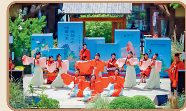
「詩經里」的周文化演出。

「蒹葭蒼蒼，白露為霜。」這首《詩經》中耳熟能詳的名篇，就誕生於「詩經里」所在一帶。「詩經里」將《詩經》所涉及的風物、民俗、音樂、人物等，轉化為國風廣場、鹿鳴食街、關雎廣場、小雅書社等景觀和建築。身著傳統服飾沉浸其中，詩夢聲聲、禮樂悠揚、丹青處處、心靜如歸，彷彿走入「詩經」之中，數千年前西周的人文風貌躍然眼前。