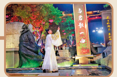
「李白」現身唐不夜城與遊客鬥詩。

與大雁塔相鄰的唐不夜城，近年來頻頻「出圈」，成為享譽海內外的頂流打卡地。人群熙熙攘攘中，「李白」一襲華服皎潔如月悠閒踱步而來，忽而詩興大起，便會停下與身邊路人即興對詩，很受歡迎。從唐不夜城步行五分鐘，便是中國首個唐文化沉浸式主題街區「長安十二時辰」。該街區融沉浸式互動式演繹、唐長安實景街區為一體，讓踏入街區的遊客化身成長安城中的一位「坊間市民」，與往來「各國商賈」、「街邊小販」一起，構成唐朝長安城市井生活。