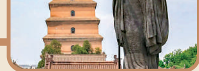
玄奘法師曾在雁塔下的大慈恩寺譯經。

始建於唐永徽三年（652）的大雁塔，位於唐長安城「晉昌坊」。這座七層磚塔，除了作為玄奘法師譯經的場所，還和唐詩有着千絲萬縷的聯繫，甚至是很多膾炙人口的唐詩創作的源頭。杜甫、白居易、岑參、高適、賈島等唐朝詩人都曾流連於此，寫下關於大雁塔的詩篇。如今他們中很多人的題字、名篇，至今還留存於大雁塔的門楣上，「雁塔詩會」的佳話傳頌至今。