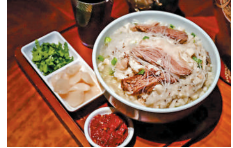
西安美食羊肉泡饃。

蛋、蔥末、糖蒜和辣醬合製而成的西北美味，其中曾登上國宴的「同盛泡饃」，已有百年歷史。該店的泡饃根據烹調方法的不同分為乾泡（無湯）、口湯（食後餘一口湯）、水圍城（湯較多）、單走（吃饃喝湯）。泡饃製作工序從選料、煮肉、熬湯，加料、調味到泡饃都極為講究，其中的吊湯工藝最為複雜，通常需要14小時才能熬製出一碗醇香的好湯。