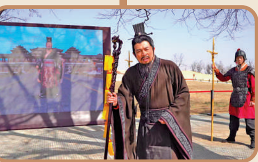
在未央宮遺址，遊客可以與「張騫」一起「出使」。