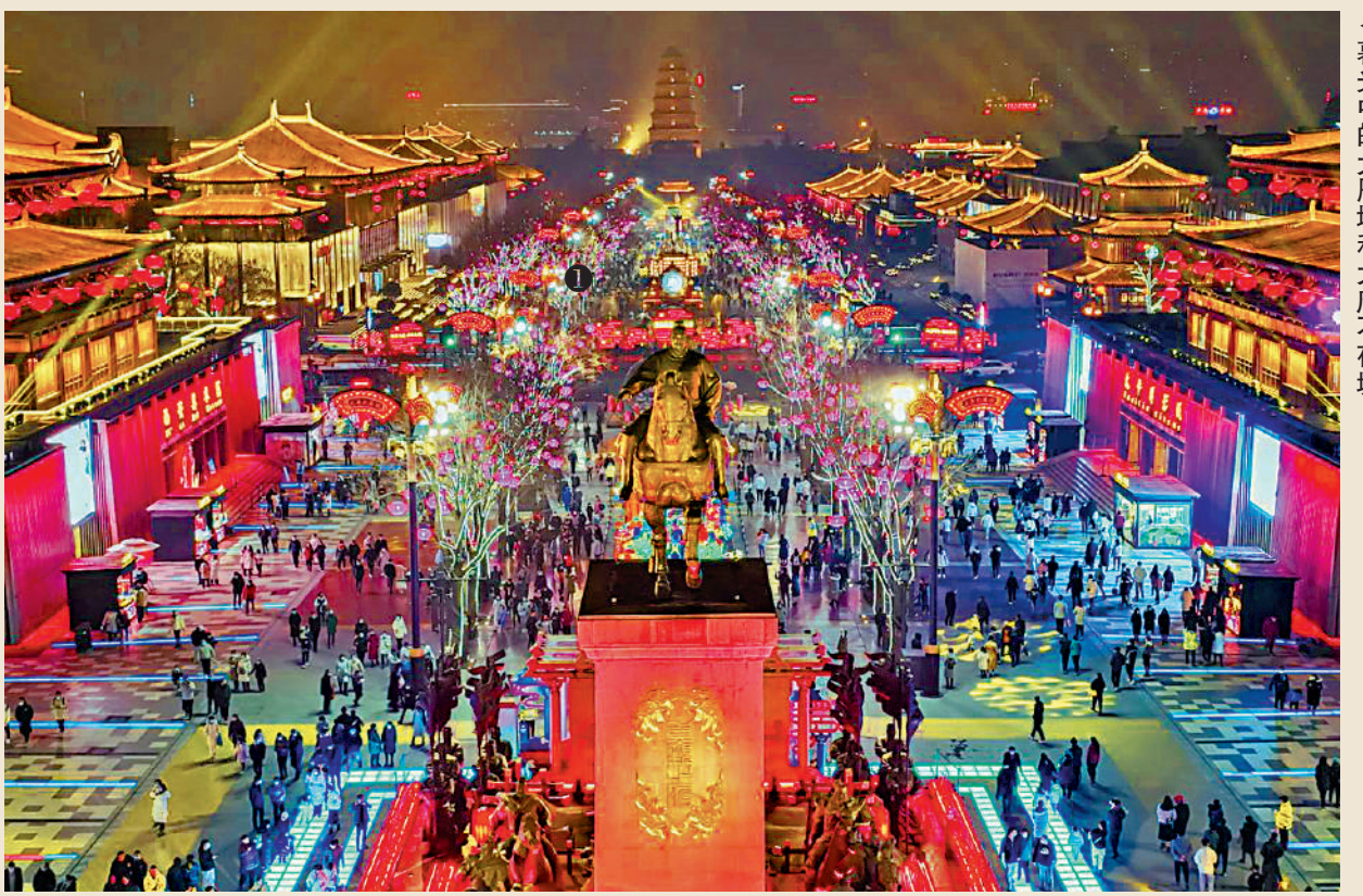
暮光中的大雁塔和唐不夜城。