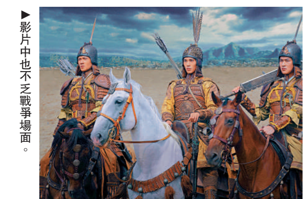
影片中也不乏戰爭場面。

受西方神話史詩類型片拍攝風潮的影響，以描寫「神仙打架」為主要內容的「姜子牙封神」故事曾被多次改編為「神話史詩大片」，但大多口碑不佳。然而，《封神1》上映時，最為觀眾稱道的是，其融合了傳統審美與東方幻想的優秀視覺效果，這與創作團隊從一開始便確定了實景、特效相結合的拍攝方式和以元末明初水陸畫做依據，融合商周青銅器元素和宋人山水的美學風格、建立獨特美學系統的創作思路密不可分。