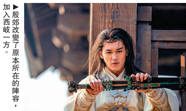
殷郊改變了原本所在的陣容，加入西岐一方。