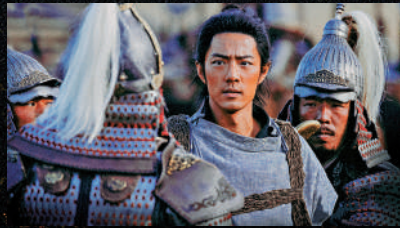
▲內地演員肖戰飾演郭靖。