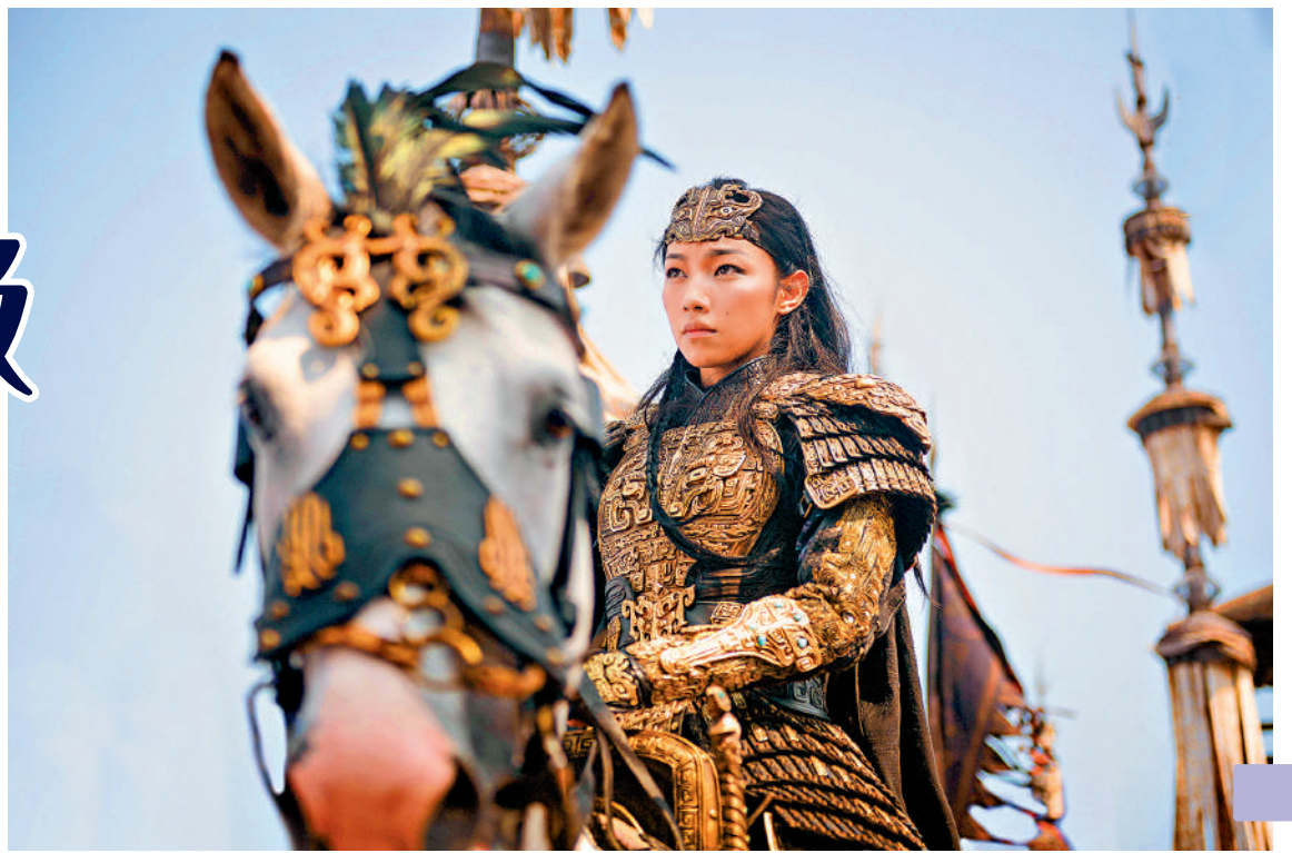
《封神2》的刻畫重點是重構鄧嬋玉。