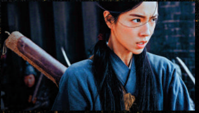
▲黃蓉的古靈精怪展現在與西毒的對手戲當中。