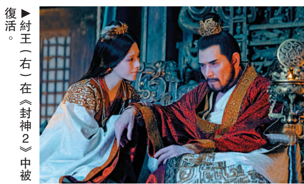
復活。紂王（右）在《封神2》中被加入西岐一方。