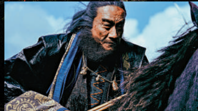
▲梁家輝在片中飾演歐陽鋒，展現十足演技。