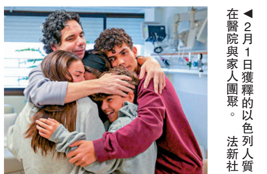
▲2月1日獲釋的以色列人質在醫院與家人團聚。

十字國際委員會。扎加里透露，獲釋人員中有150人來自加沙地帶，32人來自約旦河西岸地區，另有一人為埃及國籍，將遣返到埃及。