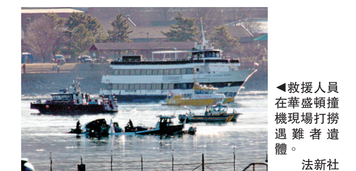
▲救援人員在華盛頓撞機現場打撈遇難者遺體。

截至2月1日，救援人員已打撈到41具遺體，目前已確認28具遺體身份。有潛水員指，有的遇難者遺體仍被客機的座椅安全帶綁住，救援人員無法立即將他們移出機艙帶出水面。另外，飛機殘骸所在位置的河水只有2.5米深，泥漿甚多，有時能見度幾乎為零，導致搜尋和打撈工作面臨巨大挑戰。