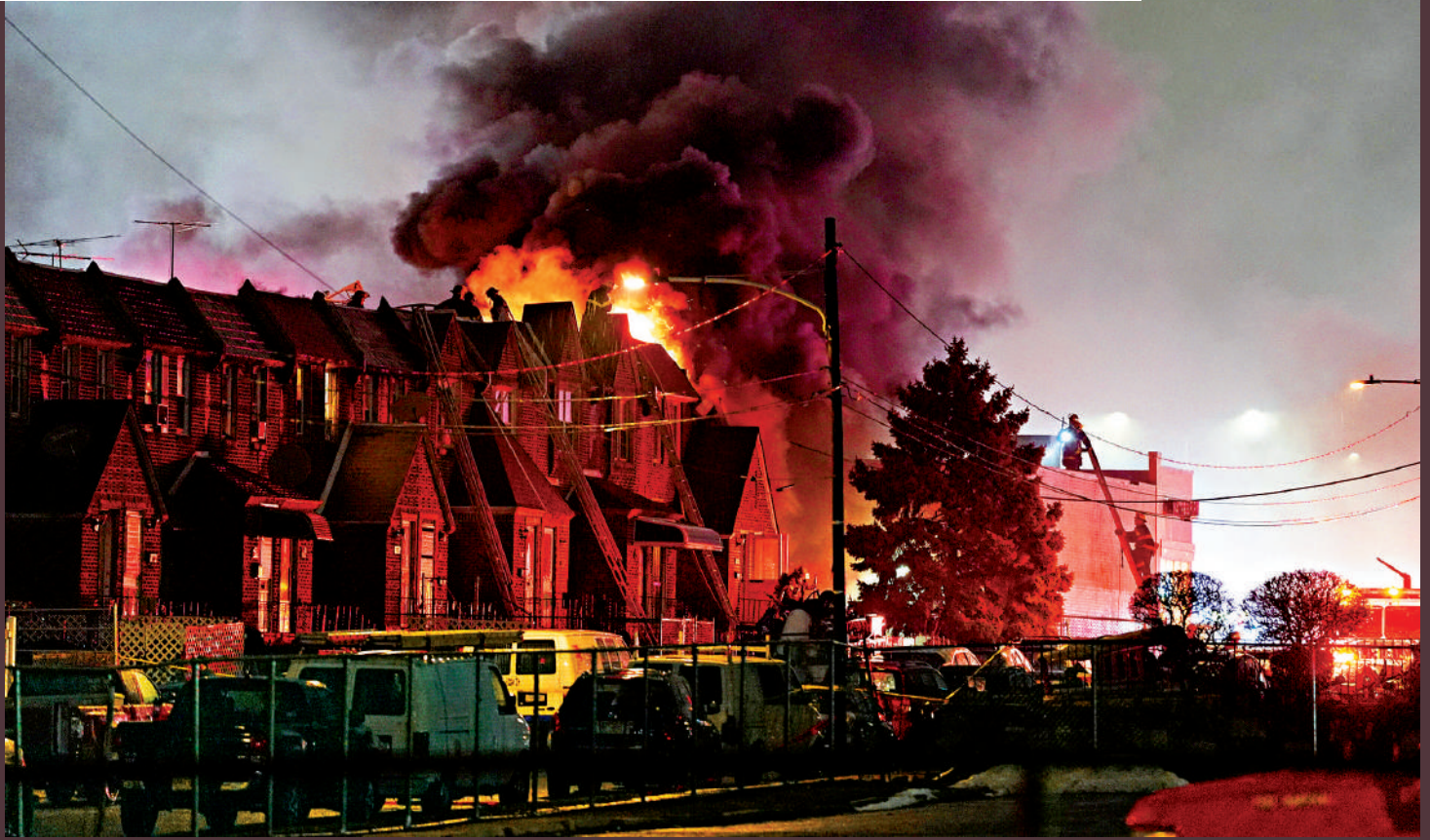
一架小型飛機1月31日晚在費城墜毀後燃起大火。

【大公報訊】當地時間1月31日晚，美國賓夕法尼亞州費城一架小型飛機發生墜機事故，墜機地點位於費城東北部一處熱鬧街區，飛機化為火球引發劇烈爆炸，導致數棟民宅起火，機上6人死亡，地面上一名在車內的人士也不幸死亡。