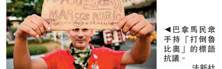
▲巴拿馬民眾手持「打倒魯比奧」的標語抗議。

穆利諾已排除與美國就運河主權進行談判的可能性，他表示：「我不能就這條運河談判，更不會開啟一段談判的過程。此事已成定局，這條運河屬於巴拿馬。」穆利諾還表示，希望魯比奧的訪問能把重點放在移民和打擊毒品販運等雙方有共同利益的議題上。