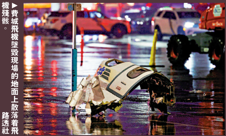
費城飛機墜毀現場的地面上散落着飛機殘骸。

美國近期航空事故不斷，4天內有4架飛機墜毀，最新一起事故發生在當地時間1月31日，一架載有6名墨西哥公民的小型飛機在賓夕法尼亞州費城一處熱鬧街區墜機，導致機上6人及地面上1人遇難。這是繼華盛頓特區1月19日發生客機與「黑鷹」直升機空中相撞事故以來，美國本周第2起空難。事故調查結果尚未公布，美國民主黨和共和黨已開始互相指責，認為對方應為事故負責。