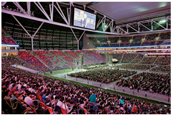
▲啟德體育園開幕後，將會有一連串包括演唱會等的盛事活動。圖為早前體育園測試情況。