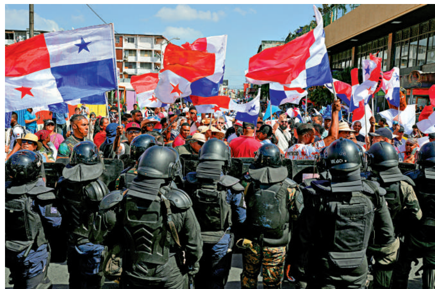
▲ 大批民眾2日在巴拿馬城示威，抗議美國國務卿魯比奧到訪。

南非總統拉馬福薩3日回應稱，南非政府沒有沒收任何土地，政府近期通過的《徵用法案》旨在確保南非公民以公平公正的方式獲得土地。他強調，除了「總統防治愛滋病緊急救援計劃援助」外，美國並未對南非提供其他重要資金支持。