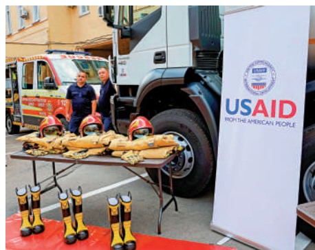
▲ 美國國際開發署負責向包括烏克蘭在內的多國進行援助。路透社

【大公報訊】綜合路透社、CNN報道：由億萬富翁馬斯克領導的美國政府效率部（DOGE）3日宣布，正關閉美國