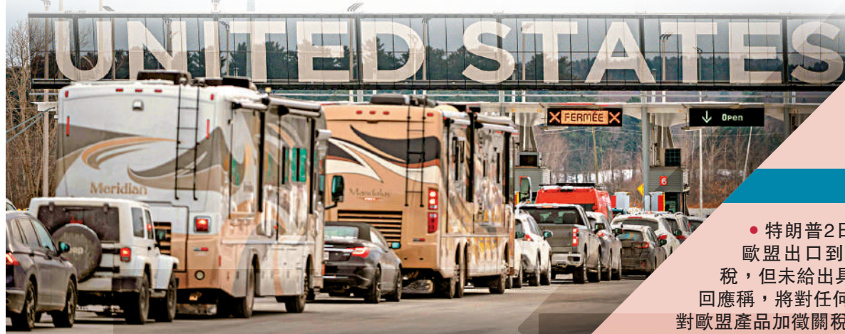
▲ 汽車在加拿大魁北克一個邊境口岸排隊等待進入美國。