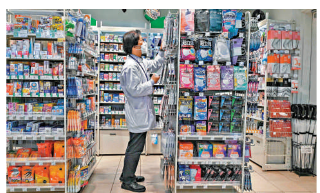
▲日本藥品供應不穩定，流病例季到來後藥品短缺問題更嚴重。

【大公報訊】綜合《日本時報》、《產經新聞》報道：日本流病例激增，藥品短缺問題日益嚴重。日媒表示，部分醫療機構此前過度囤積藥品、藥企捲入醜聞等因素影響了藥品供應鏈的穩定，加劇藥品短缺問題。