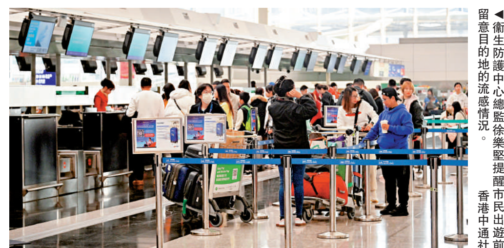
▲衛生防護中心總監徐樂堅提醒市民出遊前留意目的地的流病例情況。

徐樂堅指出，現時北半球眾多地區，包括內地、日本、韓國，以至歐洲和北美洲等地的流病例活躍程度持續上升或維持在高水平，前往外地的市民，應在出發前留意目的地的流病例情況，做好個人保護措施，包括盡