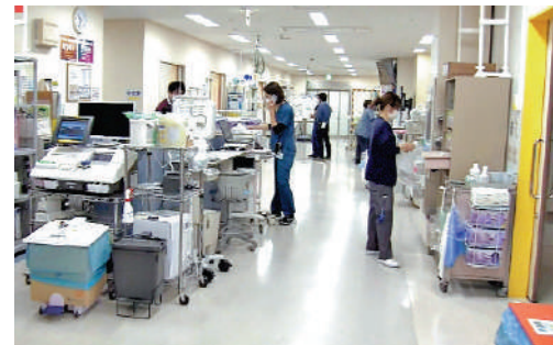
▲流病例激增，日本醫院面臨巨大壓力。 視頻截圖

小小表示，日本醫療「就是這樣」，生了病往往只能先去小醫院，「實在不行就拖成大病，拿了（小醫院出具的）介紹信去大醫院」。