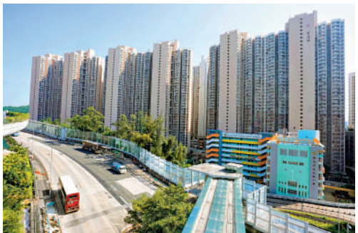
▲政府擬修例把嚴重濫用公屋變成罪行。

過去一年收回2800個單位，估計新一年數字會「維持咁上下」，而申報期正在進行中，目前有48萬個單位，即一半單位已經完成。她還表示針對嚴重濫用公屋個案主動上交，將不會設追溯期。