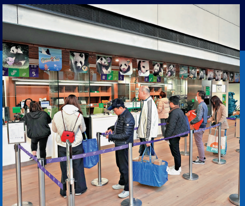
▲美國郵政昨日一度宣布停收來自中國內地及香港的包裹，即日宣布恢復服務，造成混亂。圖為香港市民到郵局投遞包裹。