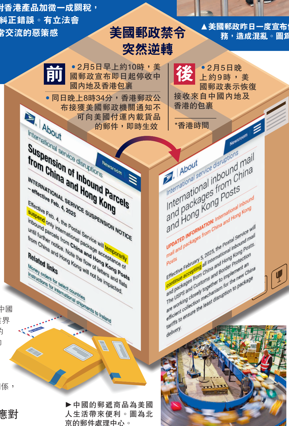
▶中國的郵遞商品為美國人生活帶來便利。圖為北京的郵件處理中心。