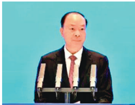
全省高質量發展大會 Provincial High-quality Development Conference

▲2月5日，廣東省委、省政府在廣州召開全省高質量發展大會，廣東省委書記黃坤明在大會上發表講話。