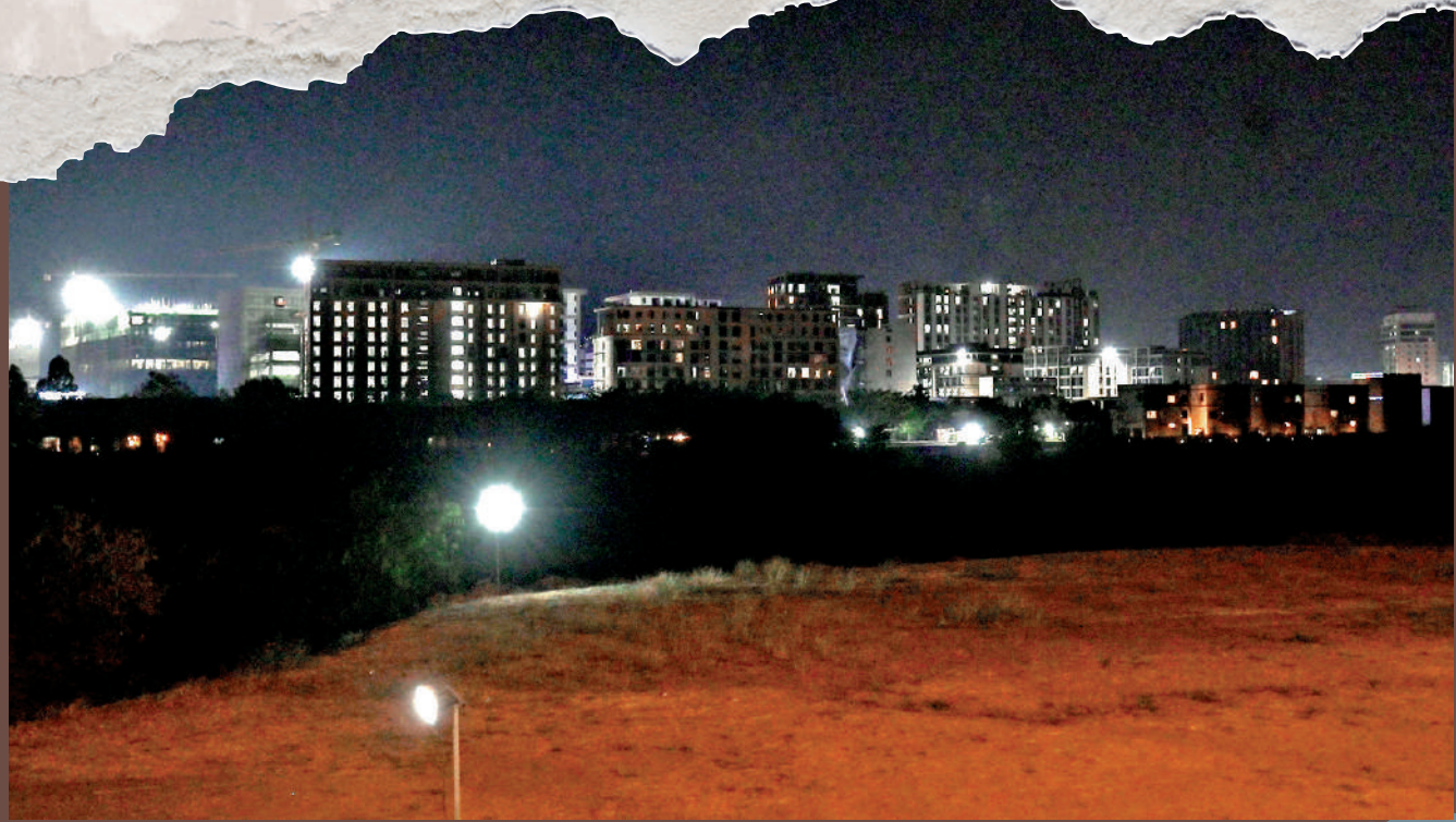
▲泰國5日正式切斷泰緬邊境5個地點的電力。日晚從泰國邊境拍攝的泰緬邊境地區。圖為4。

根據泰國政府的決定，5日早上9時起，泰國開始對泰緬邊境的緬甸地區斷網、斷電和斷油，以配合政府打擊跨境電信詐騙的決策。中國外交部發言人林劍5日在例行記者會上表示，對相關國家採取強有力措施表示歡迎。泰國媒體報道，緬甸部分地區周三開始斷電，由於民眾搶購，柴油價格已從每公升35銖飆升至60銖。