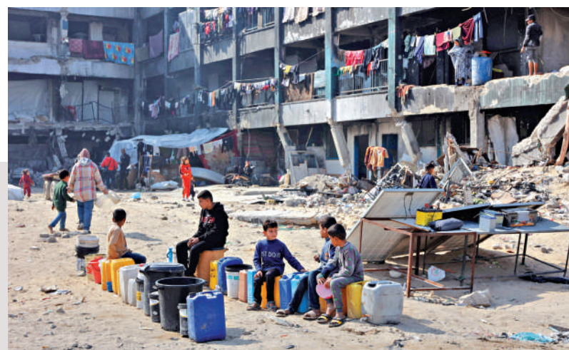
▲加沙地帶飽受戰火摧殘，但當地民眾表示不會離開家園。圖為當地民眾表示。