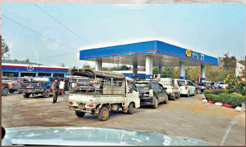
▶車輛5日在緬甸妙瓦底的加油站前排隊加油。

根據泰國政府的決定，5日早上9時起，泰國開始對泰緬邊境的緬甸地區斷網、斷電和斷油，以配合政府打擊跨境電信詐騙的決策。中國外交部發言人林劍5日在例行記者會上表示，對相關國家採取強有力措施表示歡迎。泰國媒體報道，緬甸部分地區周三開始斷電，由於民眾搶購，柴油價格已從每公升35銖飆升至60銖。