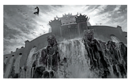
▲陳塘關大戰的前期概念圖。