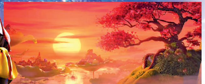
◀影片整體構圖充滿中國動畫特色。