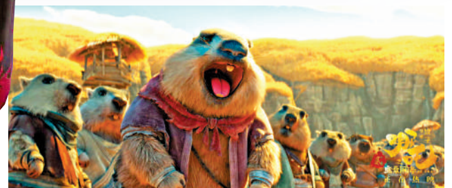
◀影片中的土撥鼠形象，十分可愛。