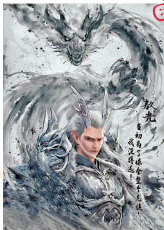
▲龍王敖光的設計十分霸氣。

物造型。太乙真人性格灑脫務實、活潑樂觀，處事更像散仙，哪吒天生魔童，二人的造型誇張簡潔；而在仙界修行的鶴童、鹿童等，平素妝容端正服飾規整，用色淡雅。性格、扮相都與哪吒形成反差的敖丙，色系高冷，修身長款，有富貴公子氣。無量仙翁與太乙真人有一脈相承之處，面部圓潤飽滿，服裝採用代表純潔的白色。其表情慈眉善目、長袍飄飄欲仙的相貌，與包藏禍心、殘酷無情的品行性格形成強烈衝突。高潮段落哪吒與無量仙翁形象都發生了判若兩人的變化。重生後的哪吒仍主打黑紅兩色，由熊貓眼變為英俊少年，如高溫鍛燒餘焰熾烈的一團火、氣勢灼人；而無量仙翁則孔武乖張，兇相畢現。正反兩大主角造型起到為視覺立極的作用，