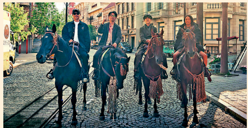
◀《唐探1900》的故事背景是1900年的舊金山唐人街。

周潤發演技一如既往的精湛，他所飾演的白軒齡只是通過眼神，都令觀眾感受到情節的推進，他在憤怒、需要忍氣吞聲的悲憤、需要理性的警告對手的眼神戲中，都有明顯的區別。尤其是最後白軒齡一個人在議會聽證會舌戰群儒，用英語為所有在美華人辯護的戲，需要用英語對白，還要與在場的眾多演員完成對手戲，即使是多個長鏡頭的切換當中，周潤發的整個表現一氣呵成。