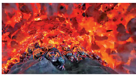
▲武戲場面注重視效。