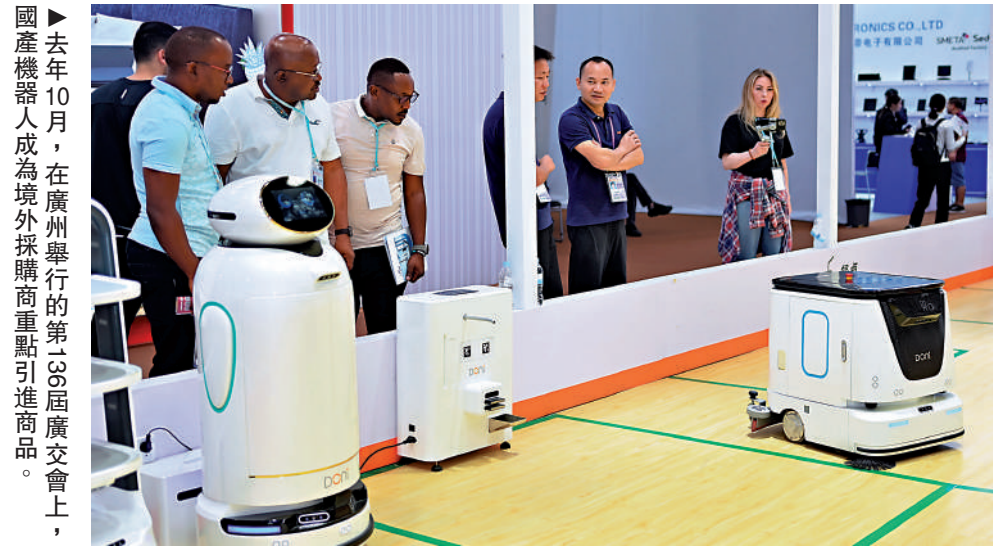
去年10月，在廣州舉行的第13屆廣交會上，國產機器人成為境外採購商重點引進商品。

面對國際環境的不確定性，廣東加快建設現代化產業體系，為在粵港企等轉型升級提供資金和場景的支持。最新公布的《廣東省建設現代化產業體系2025年行動計劃》含八大行動，廣東將打造粵港澳大灣區「應用場景發布廳」，推動不少於100項新技術新產品首試首用。