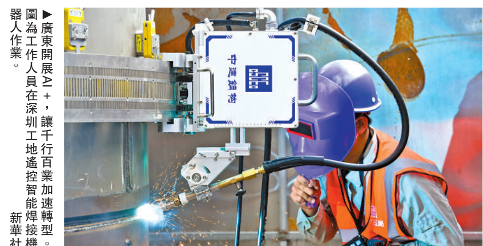
廣東開展「人工智能+」，讓千行百業加速轉型。圖為工作人員在深理工地遙控智能焊接機。