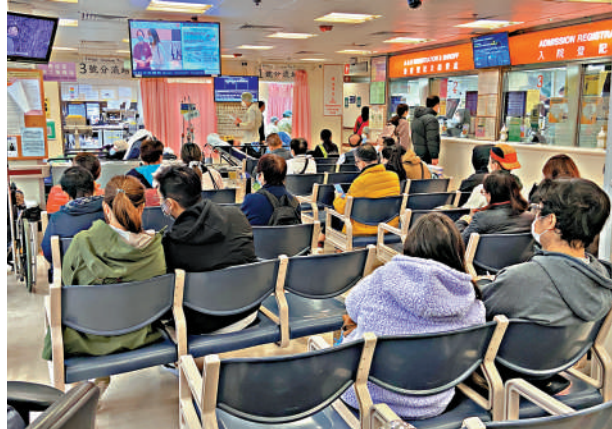
▲本港踏入流感季節以來，累計240宗嚴重流感個案，整體流感活躍程度維持在高水平。

《流感速遞》顯示，日本的流感活躍程度下降，定點監測單位呈報的流感樣疾病平均數目為11.06，較前一周的18.38有所下降，但仍高於基線水平（1.00）。當地最近數周主要檢測到的流感病毒為甲型H1N1流感。