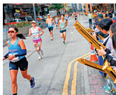
▲跑手在寒冷天氣下比賽，必須做好賽前準備。

他補充，所有跑手應該要量力而為，如果在賽事中途感到不適，便要馬上向現場醫護求助。