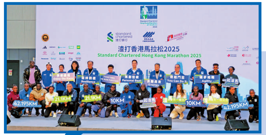
▲渣打馬拉松昨天舉行賽前記者會。