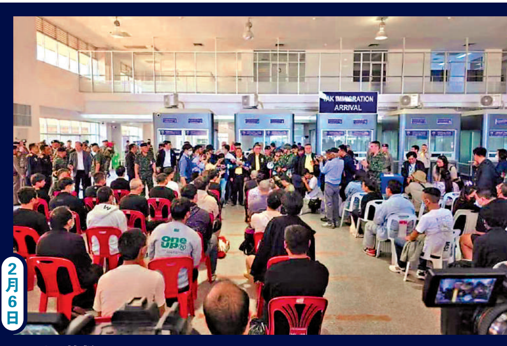
61人獲救 ▲61名緬甸妙瓦底電詐園區受害者被解救，其中包括39名中國人。