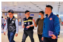
大公報記者盛德文整理