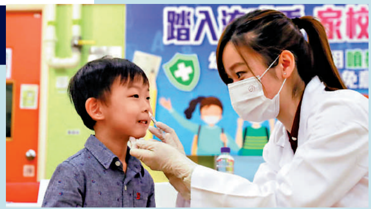
▲醫管局預期，在下周學校長假期結束後，學童感染流感宗數或會上升，呼籲家長盡快帶小童接種疫苗。