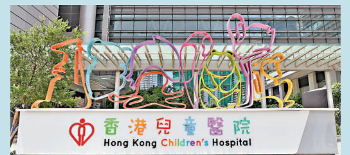
▲香港兒童醫院耳鼻喉科因為人手不足，需暫停服務，逾500名需覆診的病童要轉往其他公立醫院就診。

【大公報訊】香港兒童醫院耳鼻喉科因為人手不足，需暫停服務，逾500名需覆診的病童要轉往其他公立醫院就診。醫院管理局行政總裁高拔陞昨日就事件致歉，解釋兒童耳鼻喉科醫生人手本來就不多，預計兒童醫院耳鼻喉科可於今年下半年恢復服務。醫務衛生局局長盧龍茂表示，今次情況反映兒童亞專科需整合服務的重要性。