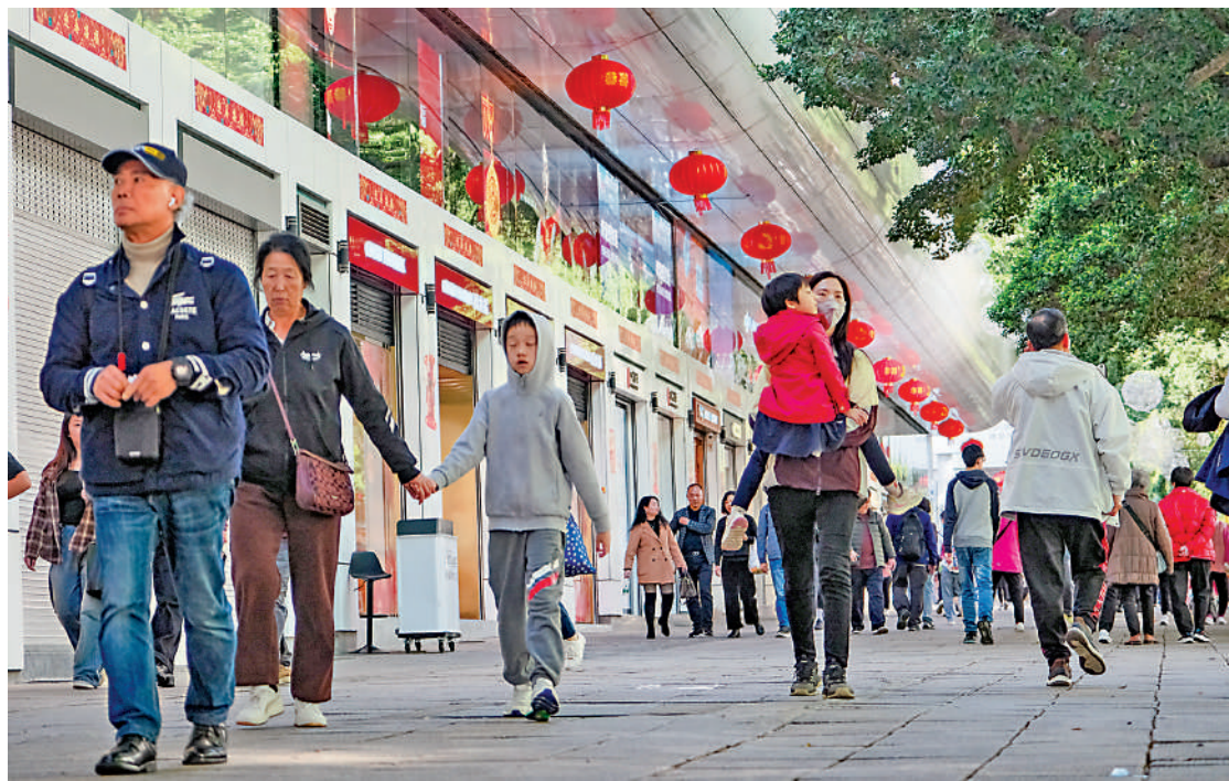
▲近期天氣寒冷，今早市區最低氣溫預測為11度，而本港正值流感高峰期，市民宜添衣保暖。

疫苗可預防疾病科學委員會主席劉宇隆昨日向大公報記者表示，第五周的流感重症及死亡個案較多，仍主要集中在幼童及長者方面，未接種疫苗的幼童在感染後出現腦炎、肺炎、敗血症等併發症的幾率升高；而長者則多數有長期病患，就50歲以下的青壯年死亡個案，則可能本身已有健康問題。