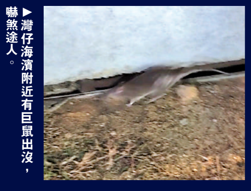
▲灣仔海濱附近近有巨鼠出沒，嚇途人。

食環署發言人表示，灣仔渡輪碼頭、HarbourChill海濱休閒站及其附近一帶涉及相關政府部門和私人管理場所，日常清潔及防治鼠患工作由有關管理單位負責，該署在有需要時會提供技術支援。接獲《大公報》反映後，該署一月二十日已聯同相關部門及私人單位視察有關地方的鼠患情況，其間發現有輕微鼠蹤，遂向其提供防治鼠患及環境衛生的技術意見。