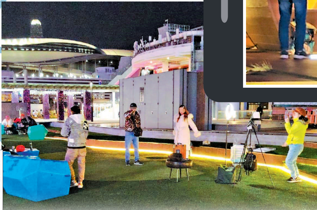
▲「網絡賣唱」進駐灣仔海濱共享空間，更配備打光燈等器材作直播。