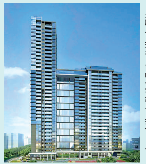
▲天麟府·臻林由兩幢住宅組成，提供166伙。

住。」該款戶型的客廳與其中一間睡房共享橫跨式觀景露台，採光通風俱佳，而主人套房配備大窗台，享受寬闊景觀。不過，銷售人員坦言，該戶型雖然優勢明顯，但仍有一些細節需要考慮，例如廚房與其中一間睡房門對門，浴室與廚房較近，對部分住戶而言可能需要適應。