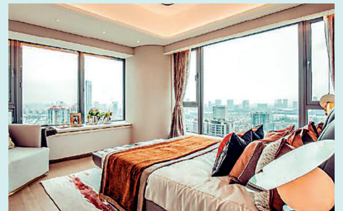
▲天麟府·臻林待售單位處於高層，景觀開揚。