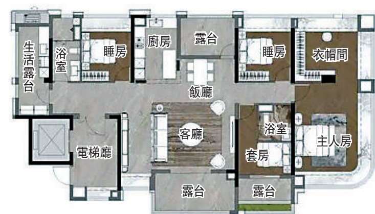
▲保利華創·都荟天珺196平米四房兩廳戶型圖。