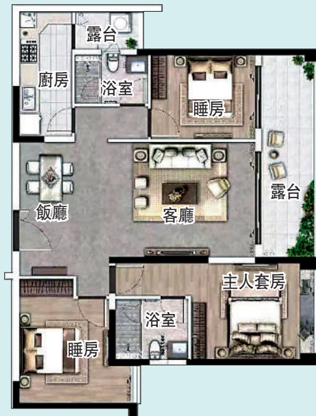
▲天麟府·臻林123平米三房兩廳戶型圖。

業內人士指，天河區豪宅一直供不應求，特別是天河公園景觀住宅更為稀缺。天河區作為廣州高端住宅市場的重要板塊，隨着地鐵環線的落成、商圈的升級，天河公園板塊的房產價值正在持續走高。