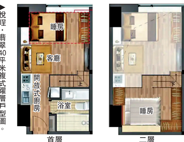
▲悅理·翡翠40平米複式躍層戶型圖。

悅理·翡翠單位採用4米高複式躍層設計，空間靈活，主打全屋精裝，家電傢俱配置齊全，自住出租皆宜，並由悅理酒店提供代租代管服務。據銷售人員介紹，該服務可保障業主穩定收益，降低自主管理的成本和風險。根據市場數據，天河北核心區的單身公寓月租約4000至7000元，部分帶管理服務的單位可達8000元以上，租金回報相對穩定。不過，該項目儘管屬於新盤，但其所在的瑞華大廈是一個樓齡較高的商業大樓，樓下是連鎖酒店，周邊環境比較複雜。