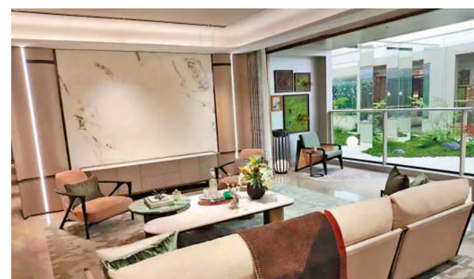
▲保利華創·都荟天珺主打大平層戶型，格局開闊，設高標準精裝配置。