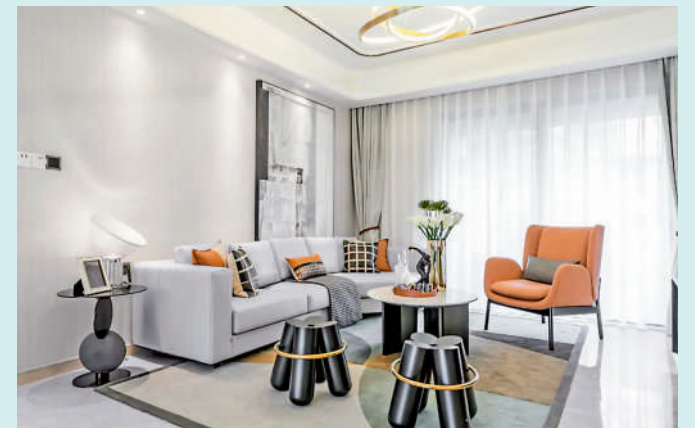
▲天麟府·臻林戶型布局動靜分區合理，簡約舒適。