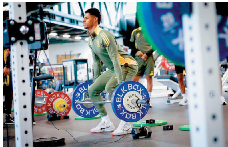
拉舒福特在休息日主動加操，提升狀態。