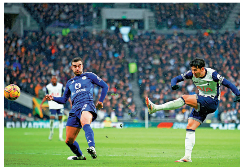
▲熱刺前鋒孫興民（右）。