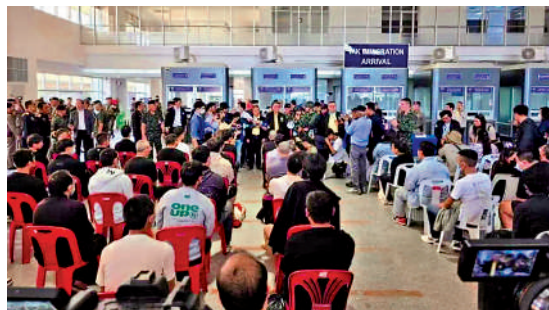
▲6日，61名被誘騙至緬甸電詐園區的外籍人員被緬甸警方移交給泰國達府邊境檢查站，其中包括39名中國公民。