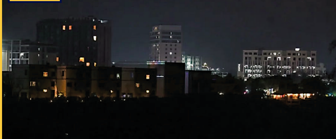
▲泰國從2月5日早上9點開始，切斷緬甸電詐園區電力供應。從斷電前後當地照片可見，斷電後雖然有些燈還亮着，但大部分地方與之前相比已是一片漆黑。