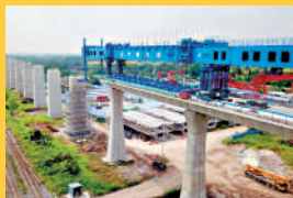
▲位於泰國大城府的中泰高鐵施工現場。

● 雙方同意共同加快中泰鐵路一期工程建設，盡快確定二期合作模式，爭取盡早啟動二期工程建設。雙方認為應當扎實推進中老泰聯通發展構想，確保三國早日實現「無縫聯結」。