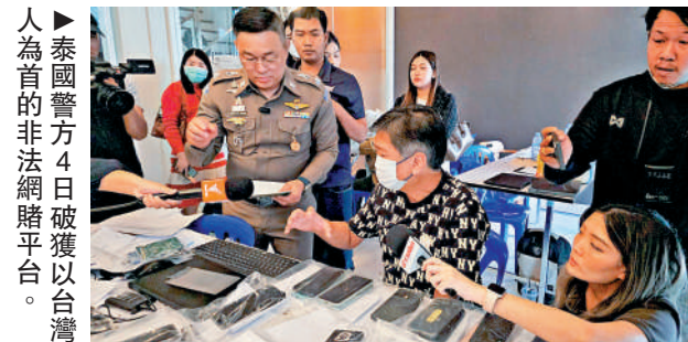
▲泰國警方4日破獲以台灣人為首的非法網賭平台。