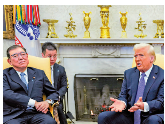
▲美國總統特朗普7日在白宮會見日本首相石破茂（左）。

當石破茂被記者問到「如果美國對日加徵關稅日本是否會採取報復性措施」時，石破茂沒有正面回答，僅稱「不回答假設性問題」。這一回答引發在場記者一片笑聲。特朗普也笑着說：「好答案，他真是個明白人。」