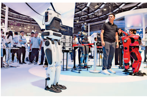
▲專家建議中國企業應逐漸向高技術方向轉型。圖為深圳一家科技公司生產的雙足機器人。

更長遠來說，中美經貿博奕還要轉向更深層次的產業鏈重構和規則制定權的爭奪。中國企業需要內生創新，包括放寬互聯網管制，讓企業獲得更多的信息和技術情報；以及加強法制保護和產權保護，推動企業更加市場化。