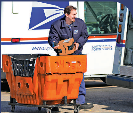
▲美國郵政員工在伊利諾伊州一家郵局外將包裹放上運貨車。