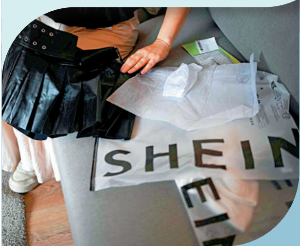
▲來自Shein等中國電商平台的商品深受美國等多國消費者喜愛。